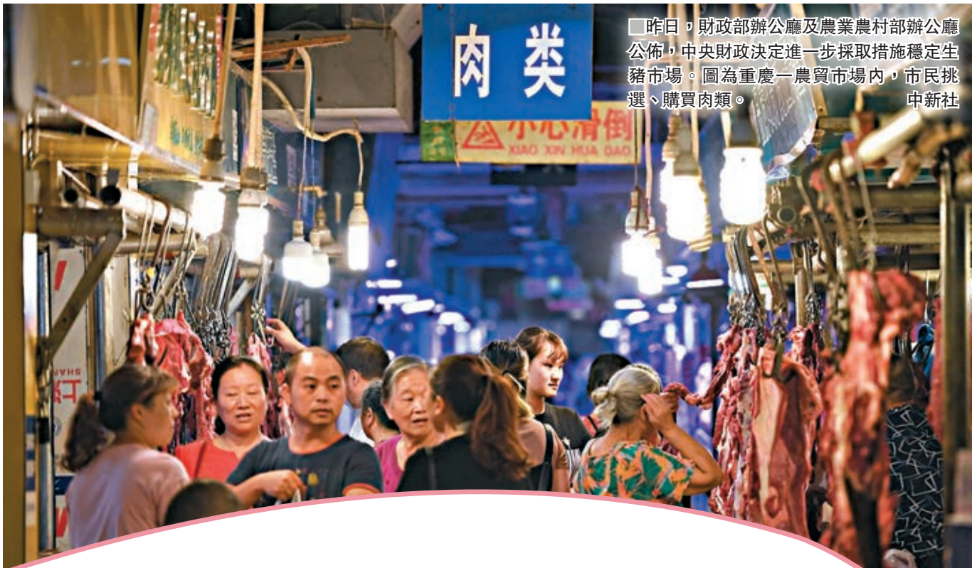
■昨日,財政部辦公廳及農業農村部辦公廳公佈,中央財政決定進一步採取措施穩定生豬市場。圖為重慶一農貿市場內,市民挑選、購買肉類。

香港文匯報訊(記者 凱雷、實習記者 李劍寧 北京報道) 國家統計局昨日發佈的數據顯示,8月下旬生豬價格每千克27元(人民幣,下同),同比上漲10.7%,且較6個月前價格翻倍。針對生豬價格持續上漲,國家多個部門密集出招促生產、穩豬價,以保各大城市供應。香港文匯報記者從財政部了解到,為貫徹落實黨中央、國務院關於穩定生豬生產保障市場供應的部署要求,財政部決定進一步採取措施,包括延長與擴大種豬場、規模豬場臨時貸款貼息時間與範圍,促進生豬生產、保障市場供應。