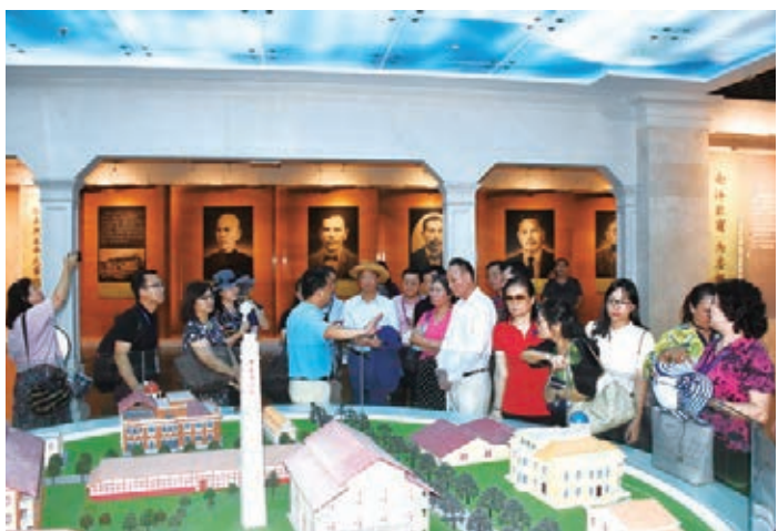
考察團部分成員在陳嘉庚紀念館參觀

8月28日，考察行程的最後一天，團員來到由亞洲近代史上極具影響力的華僑代表陳嘉庚創辦的集美學村，參觀了坐落在嘉庚公園北門外以東填海處的陳嘉庚紀念館。紀念館佔地104,484平方米，建築面積11,000.5平方米，通過珍貴的歷史圖片、文物、視聽