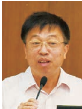
福建省委統戰部副部長翁雄宇主持歡迎晚宴