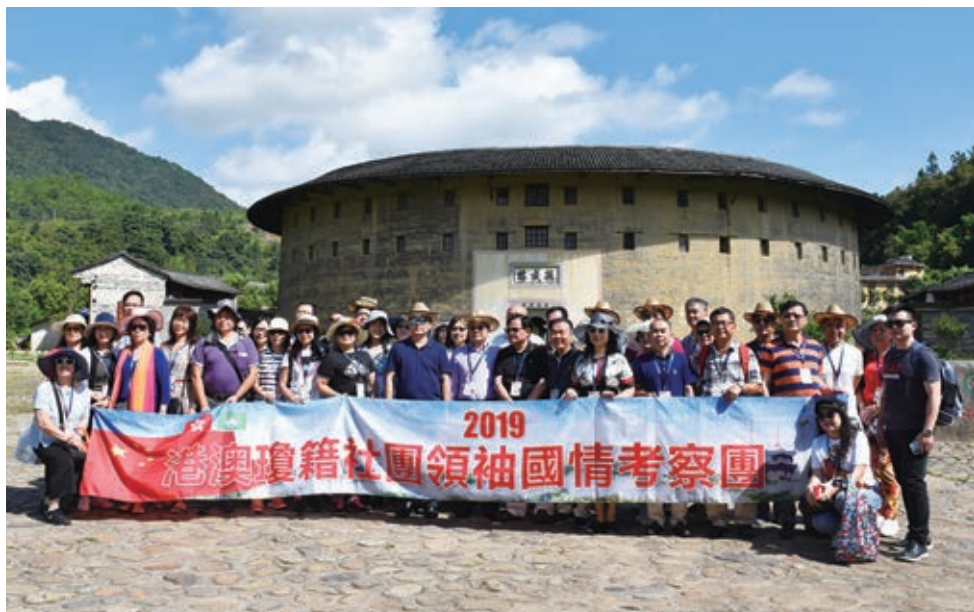
考察團部分成員在永定洪坑土樓文化區振成樓前合影

福建的地理特點是「依山傍海」，在風水上是非常好的地方，這裡更是媽祖的起源地。據史載，媽祖為福建莆田湄洲人，姓林名默娘。從歷史記載看，自宋代以來，媽祖有救贖顯靈之功，不僅千餘年來一直受到人們（特別是沿海地區）的敬仰和崇拜，而且得到歷代中央政府的鼓勵和褒封。因此所有的漁民都要拜媽祖，以保出海平安。