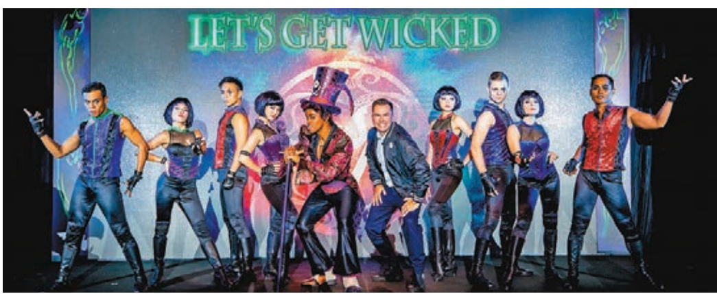
迪士尼樂園在萬聖節期間推出全新「惡人舞動迪士尼」歌舞匯演，聚集5大經典「惡人」形象。香港迪士尼樂園供圖

不過，本港現時旅遊業受到衝擊，迪士尼亦未能獨善其身，園方表示，現時迪士尼遊客情況與整體旅遊業面對的環境相若，香港迪士尼會謹守崗位，繼續提供創意娛樂項目，並推出適時優惠，吸引本地與世界各地旅客到訪。