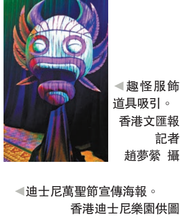
趣怪服飾道具吸引。香港文匯報記者趙夢繁攝 「惡人舞動迪士尼」歌舞匯演，聚集5大經典「惡人」形象。香港迪士尼樂園供圖