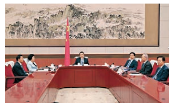
國務院決定任命賀一誠為澳門特別行政區第五任行政長官。

國務院副總理韓正、孫春蘭、劉鶴，國務委員王勇、肖捷以及國務院全體會議其他組成人員出席會議。