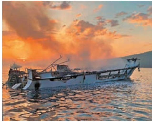
船隻嚴重焚毀，不久後沉沒。