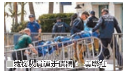
救援人員運走遺體。