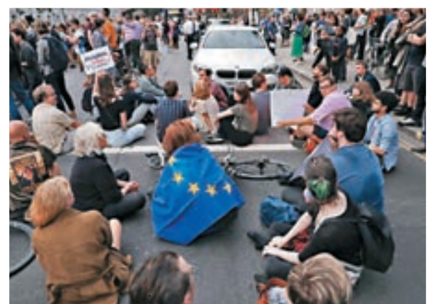
反脫歐示威者佔據國會外道路。