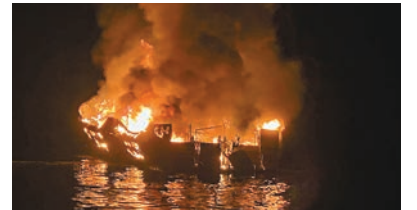
消防無法登船。