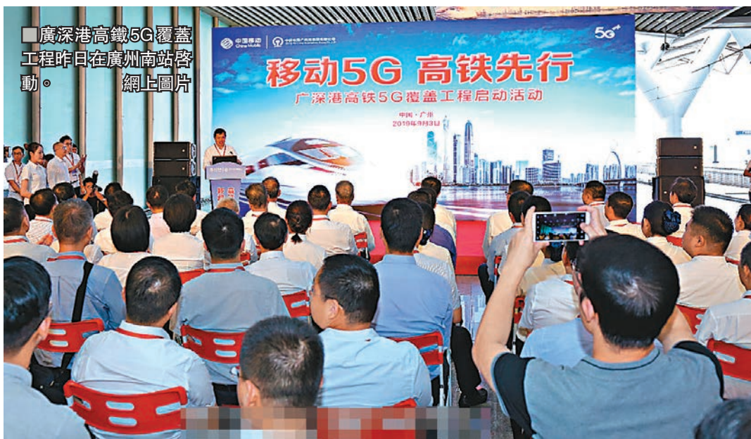
廣深港高鐵5G覆蓋工程昨日在廣州南站啟動。

在移動通信的網絡覆蓋中,高鐵場景一直很複雜。專家指出,高鐵列車的封閉性很好、列車速度很快、用戶集中、沿線場景的多樣化等特徵,使5G網絡覆蓋在高鐵場景中面臨挑戰。