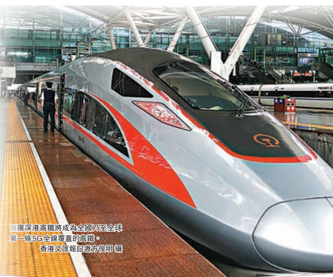
廣深港高鐵將成為全國乃至全球第一條5G全線覆蓋的高鐵。

中國移動廣東公司有關負責人表示,明年要在廣東的縣以上核心區域實現5G網絡連續覆蓋,而今年率先在廣州、深圳完成網絡覆蓋,還將攜手華為、南方電網、廣汽集團、廣東省人民醫院等合作,加快5G應用創新,助力打造「9+2」大灣區智慧城市群。