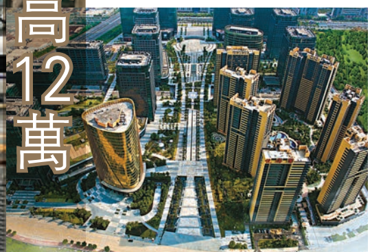
順德港澳城局部規劃。

此外,佛山正有步驟地打造對接香港高端資源的平台,推動港澳服務+佛山實業的合作。位於佛山經濟強區順德的港澳城,是其中一個重磅項目。該項目包括兩個片區,總面積達100平方公里。其中一個是20平方公里順德港片區,目標打造港澳青年創新創業示範區,對接港澳科創、金融等高端服務。第二個是80平方公里順德均安鎮片區,定位功夫特色小镇。整個平台將統一規劃,利用順德港「點對點」直通香港、順德共同文化IP——李小龙功夫、港澳鄉親資源豐富等優勢,主動對接港澳科創、金融、工業設計等資源,引進高端醫療和養老服務,與香港共建世界級功夫小鎮,打造大灣區中的港澳創新創業合作平台,爭取更多高端產業項目、文旅項目落地。