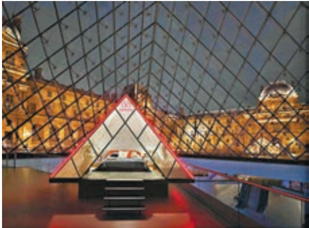
■ Airbnb發展迅速，甚至與羅浮宮合作，讓旅客在特別打造的金字塔臥房住宿一晚。