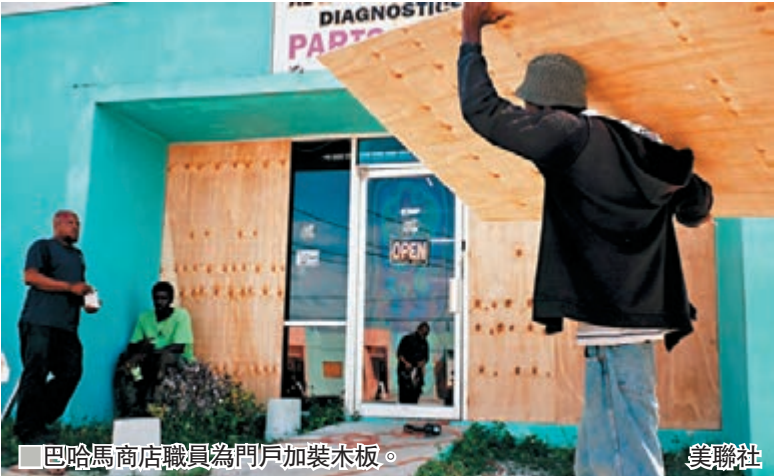
巴哈馬商店職員為門戶加裝木板。