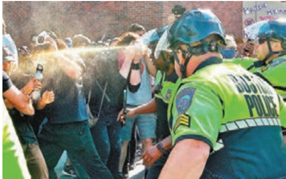
警方施放胡椒噴霧，驅散衝擊警員的示威者。

美國一個支持總統特朗普的右翼組織「超級開心享樂美國」(SHFA)，前日在波士頓發起名為「異性戀驕傲」的遊行，強調他們屬於「被打壓的大多數」。有批評者指發起人是白人至上主義極端分子，一批爭取同性戀權益人士現身「踩場」，又不滿警方保護「納粹分子」，與警方爆發衝突，警員發射胡椒噴霧驅散，共拘捕36人。 約數百人參加「異性戀驕傲」遊行，不少人身穿印有美國國旗的衣服，亦有人揮動以色列國旗，他們認為自己連反對同性戀的權利也沒有，形容是「被打壓的大多數」。帶