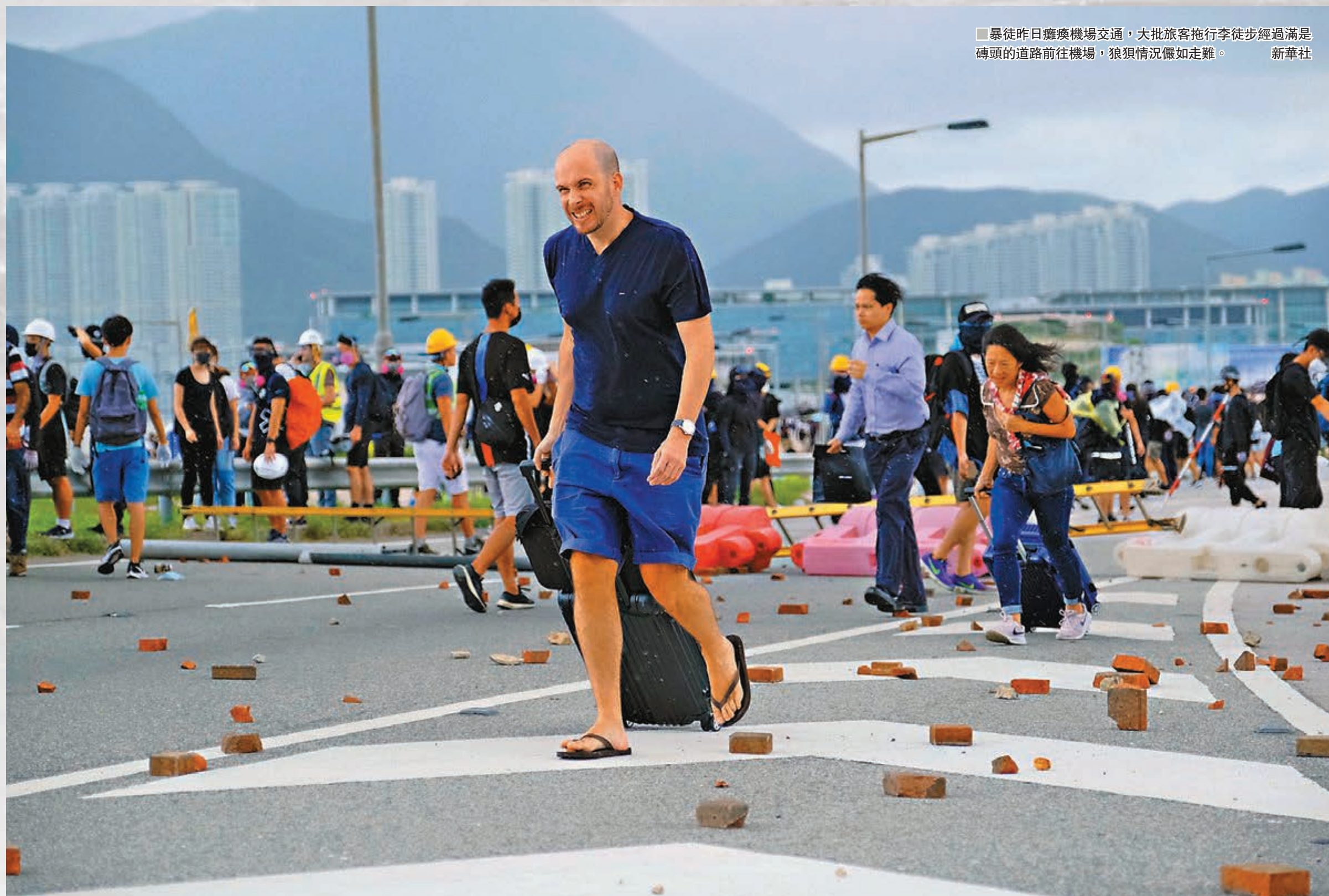
■暴徒昨日癱瘓機場交通，大批旅客拖行李徒步經過滿是磚頭的道路前往機場，狼狽情況儼如走難。