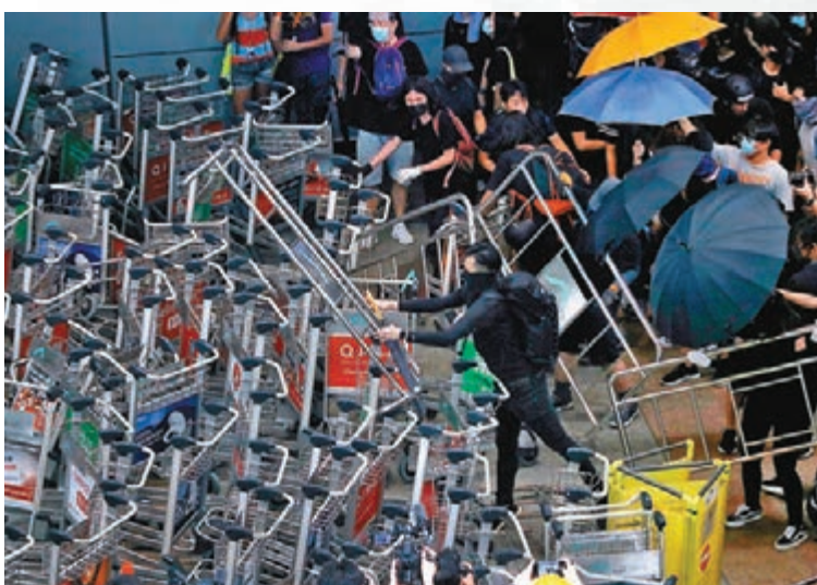
■黑衣暴徒將機場行李車堆在一起阻礙道路。