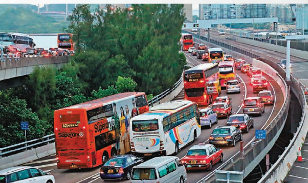
■前往機場方向的交通受到嚴重阻礙。