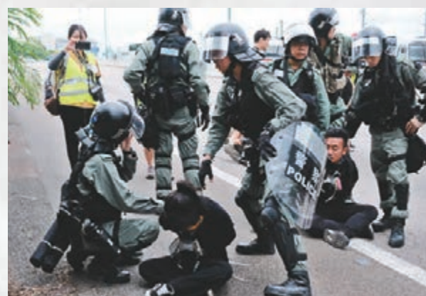
■警方在北大嶼山公路往機場方向拘捕兩名暴徒。