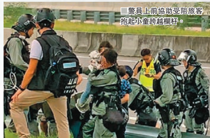
■警員上前協助受困旅客抱起小童跨過欄杆。

另外，一位居港的母親從英國回港，但遲遲未有交通工具接她出市區，「明天（今日）開學了，我無法想像自己帶着孩子在機場過夜。」她哀求暴徒們放過香港，放過旅客，讓他們順利回家。