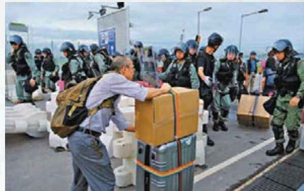
■警方清理機場附近路障，助旅客通過。

行，原訂昨晚11時起飛，惟因得悉會有人非法集結到機場搞事，故提早12小時、於昨晚11時已乘的士來到機場。他說：「好彩提早來，雖然要長時間呆等，也算是明智之舉。」