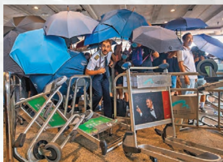
■一名機師在暴徒人群中艱難通過。