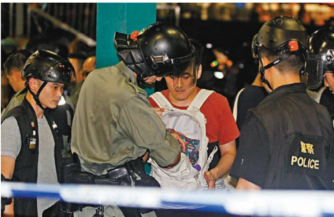
■警方在中環碼頭截查可疑者。

至傍晚約6時20分，大批連龍警員及防暴警察趕至青衣站內，截查可疑者。此時暴徒不敢乘機鐵，數百名暴徒步行至梅窩碼頭搭船出中環。8時許，有防暴警員在中環來往梅窩的碼頭，等候由東涌乘船出中環