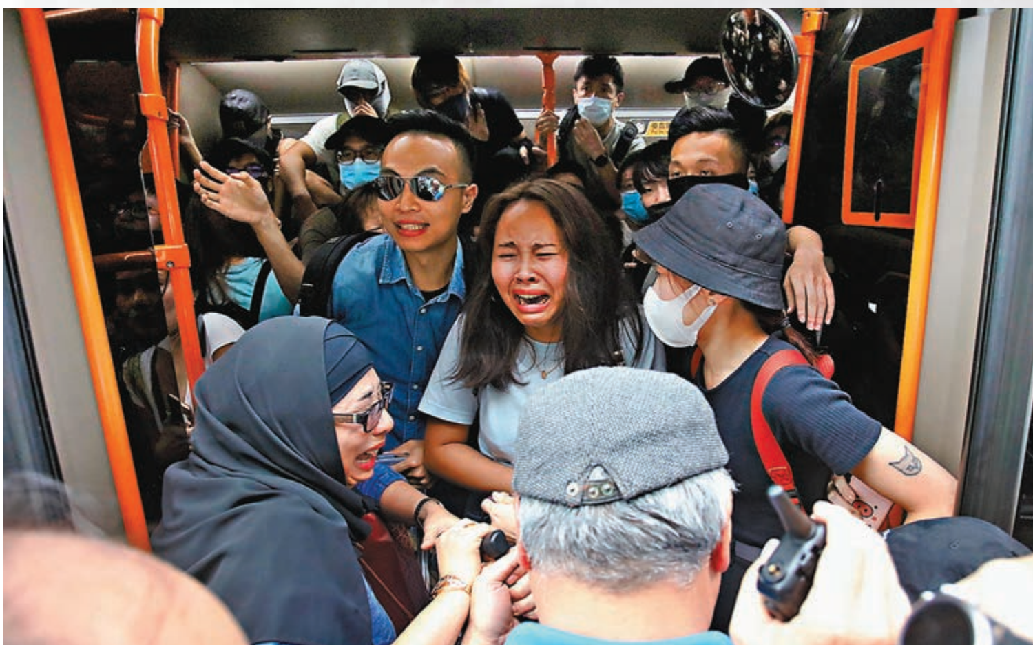
旅客因巴士受阻焦急痛哭。