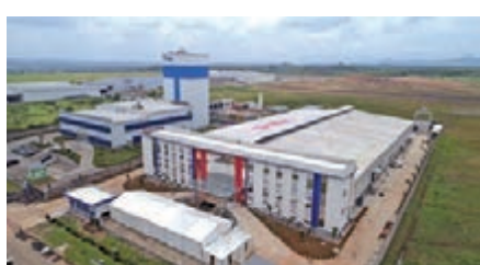
截至目前，長飛公司海外布局產能全部投產。圖為長飛印尼光通信公司

2019年7月，長飛公司與秘魯政府簽署國家寬帶合作項目，項目覆蓋約1683個城鎮、超過100萬人口，協議金額達4億美元。