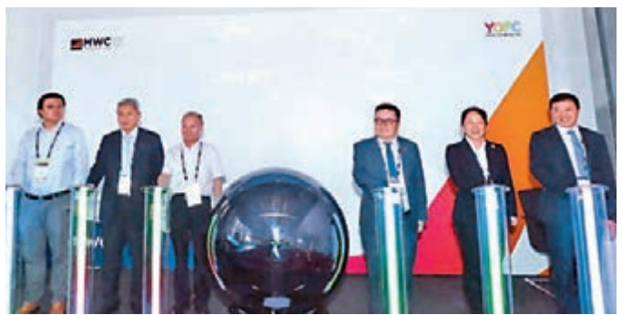
6月26日，長飛公司在2019MWC，面向全球發布5G全連接戰略、國內首個「5G+全光網絡」工業互聯網解決方案

5G牌照發布當月，2019世界移動大會(MWC2019)在上海舉行，長飛公司面向全球發布「5G全連接戰略」。該戰略定位「全場景、優品質、高效率」，針對5G承載網絡密集組