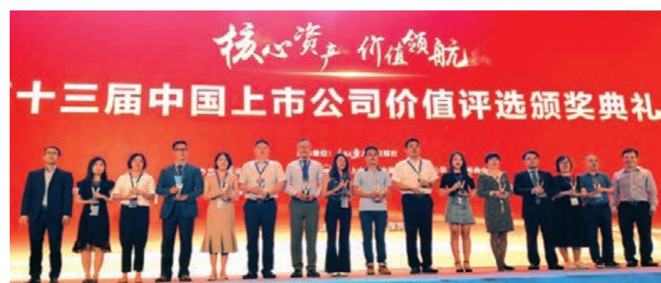
長飛公司在「第十三屆中國上市公司價值評選」中，獲評「中國上市公司IPO新星獎」

負債率下降也使得長飛公司財務費用銳減，2019年上半年財務費用429萬元(2018年同期，3098萬元)，下降約86.15%。管理費用、銷售費用也同期大幅下降。