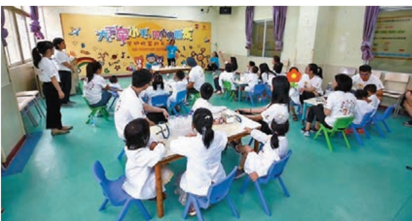
科學實驗課活動現場。

頒獎禮後，大會舉行互動環節，邀請嘉賓與學生分享人生的成功經驗，為學生們帶來良好的啟發。