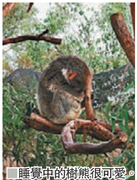
■ 睡覺中的樹熊很可愛。