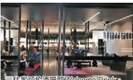
■ 住客可於酒吧取 Welcome Drink。