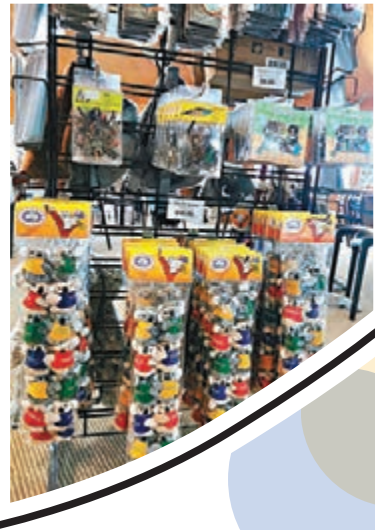
■ Wetland Cafe 及禮品店同在一個位置。