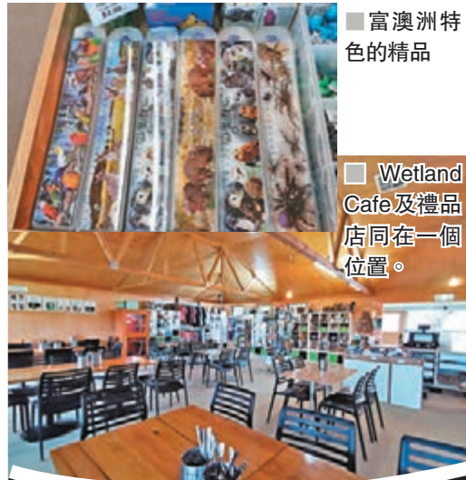
■ 富澳洲特色的精品