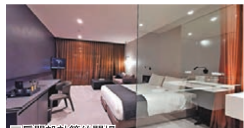
■ 房間設計簡約開揚