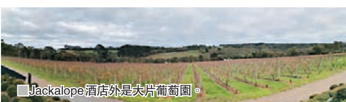
■ Jackalope 酒店外是大片葡萄園。

而且，由於這兒所處的地方較為郊外，相信不少遊客住酒店都會想買一些飲料，這兒雪櫃內大部分飲料都是免費供住客享用，大家可以享受這兒的啤酒，喝着啤酒看電視，多麼寫意。如想到更多的酒莊參觀，大家只需駕車一會兒，即可到達當地許多著名的旅遊景點如駿馬博士釀酒廠和 Fenian Wines。