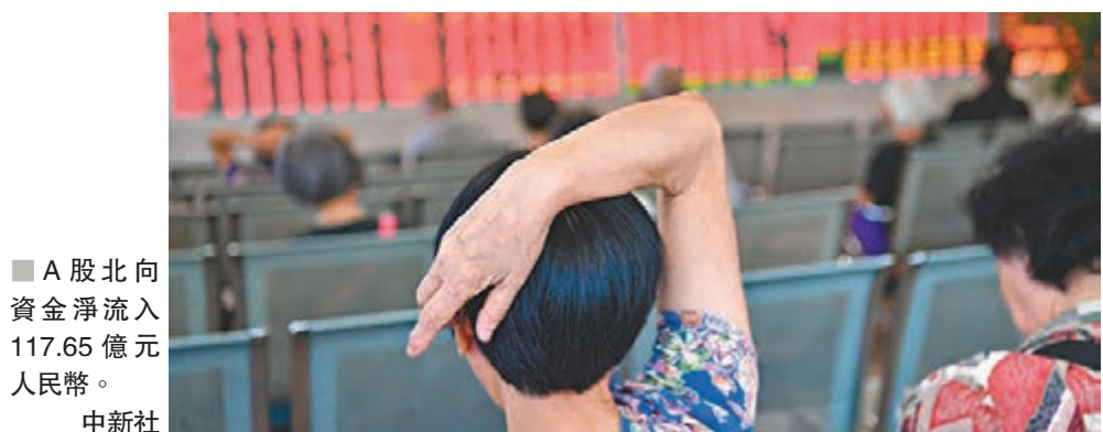
■A股北向資金淨流入117.65億元人民幣。

香港文匯報訊（記者 章蘿蘭 上海報導）MSCI第二次擴容昨日盤後生效，A股久旱逢甘霖，迎來超百億元（人民幣，下同）北向資金淨流入，助攻上證綜指收復2,900點關口，深圳成指和創業板同樣報升。瑞銀證券中國股票策略團隊認為，若中國進一步開放、發展市場，如允許在境內外交易所推出股指期貨和其它衍生品，料MSCI將進一步提升A股權重的市場意見徵詢。