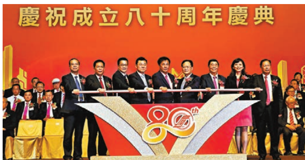
香港福建同鄉會慶祝成立80周年慶典，謝鋒陳冬仇昱陳飛等主禮。

慶典現場，該會還向會員頒發了長期服務獎、會務基金特別貢獻獎、社會事務特別貢獻獎。