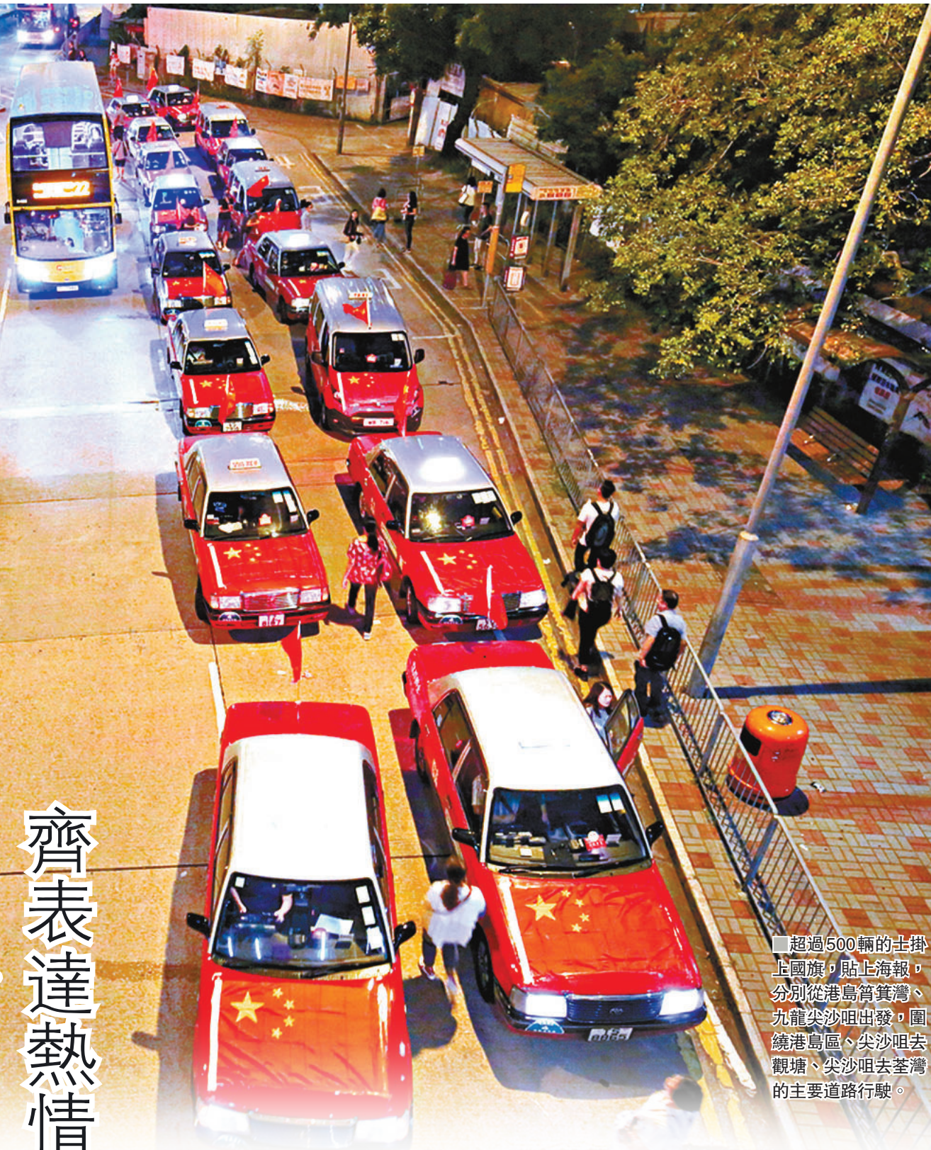
超過500輛的士掛上國旗，貼上海報，分別從港島筲箕灣、九龍尖沙咀出發，圍繞港島區、尖沙咀去觀塘、尖沙咀去荃灣的主要道路行駛。

香港文匯報訊（記者 文森）香港過去逾兩個月來發生無數遊行與衝擊事件，令香港形象插水、旅客止步，嚴重影響本港旅遊與零售業發展。旅客量減少更令的士司機收入每況愈下，連本地客的生意也因暴徒堵路而受損。「守護香港大聯盟」聯同香港的士從業員總會於昨晚發起「守護香港，風雨同舟」行動，全港逾500部的士於車身掛上中國國旗及貼上海報，分別從港島筲箕灣及九龍尖沙咀出發，圍繞港島區、尖沙咀至觀塘及荃灣行駛，望能藉此表達的士司機們愛國愛港、熱情好客的服務態度，吸引旅客訪港並對香港重拾信心。