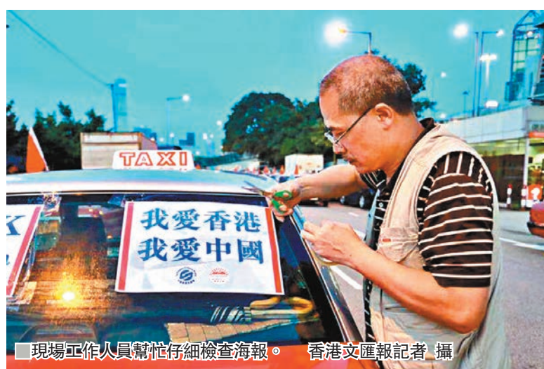
現場工作人員幫忙仔細檢查海報。