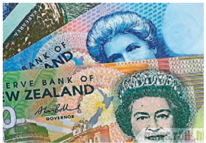
紐元兌美元周四跌破9月7日低位，創2016年1月以來最低水平。圖為紐元貨幣。