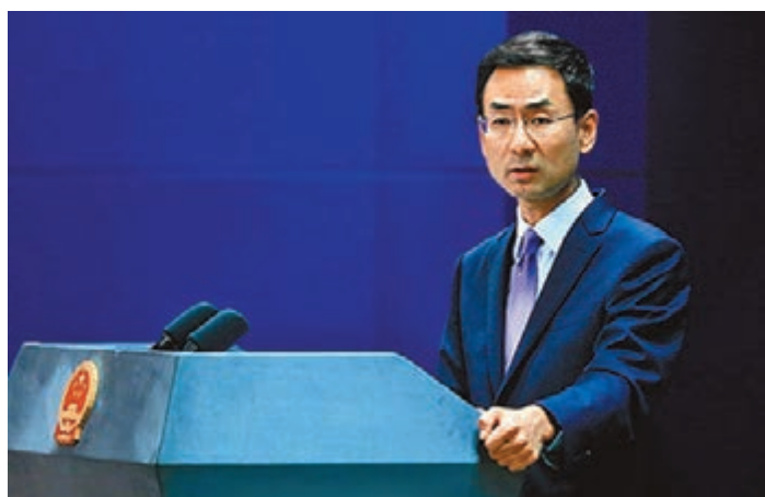
外交部發言人耿爽。

耿爽表示，我們多次指出，中美經貿合作的本質是互利共贏，中美已經成為彼此最大貿易夥伴國和重要投資對象國，形成了「你中有我、我中有你」的利益格局。目前美國企業在華年銷售額達7,000