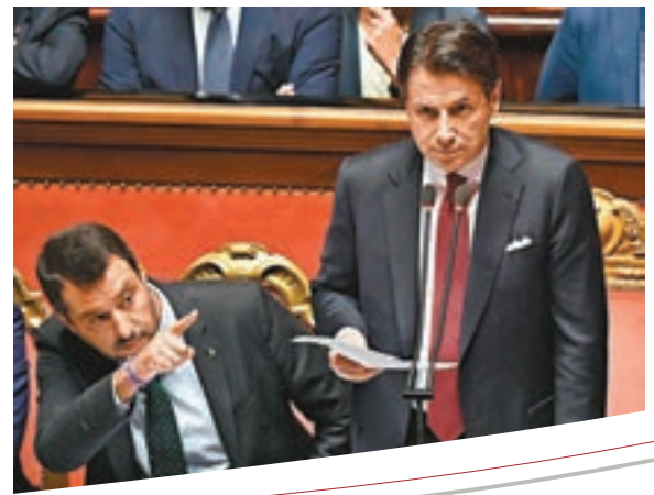
薩爾維尼指向孔特。