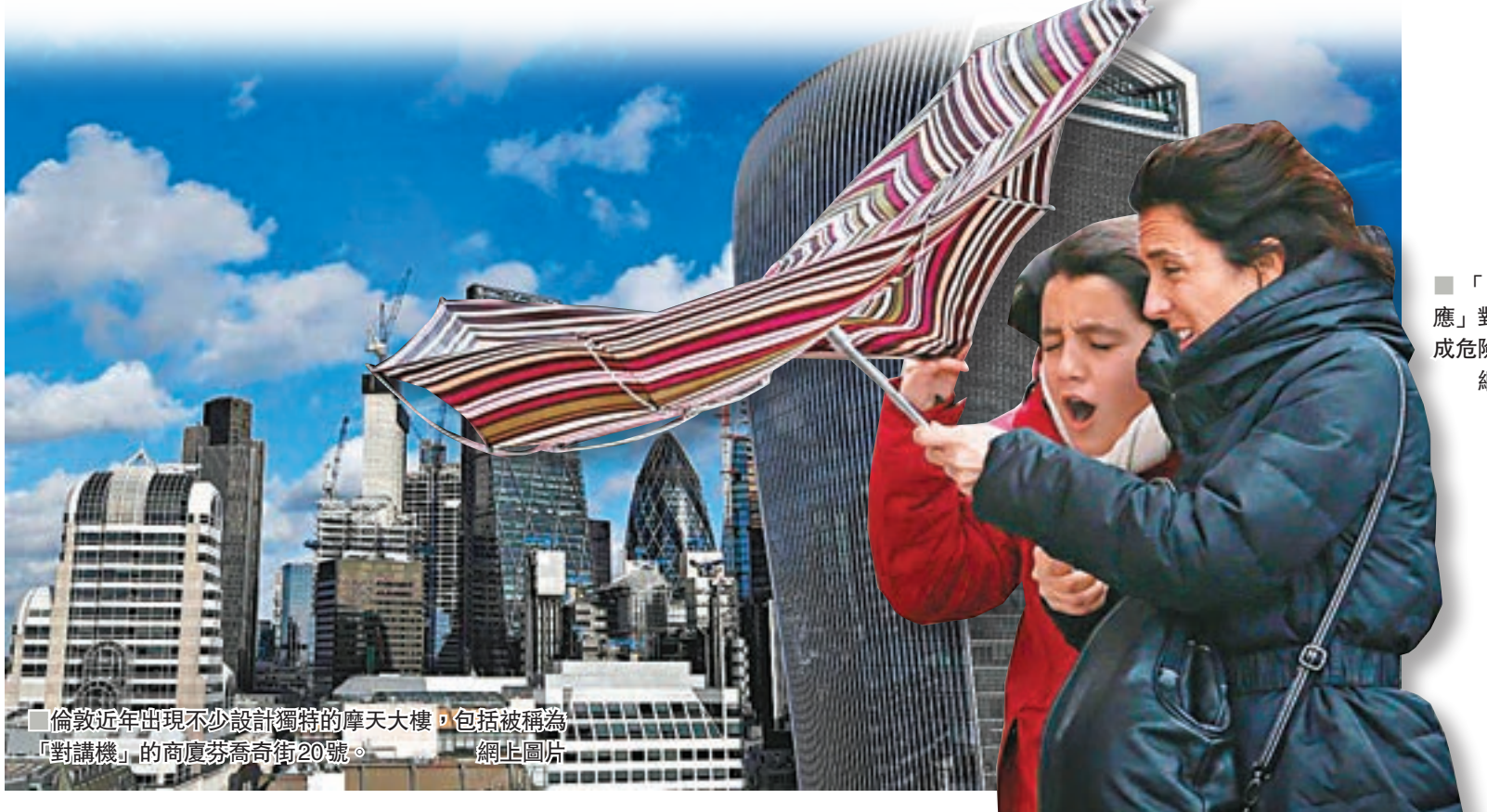
倫敦近年出現不少設計獨特的摩天大樓，包括被稱為「對講機」的高度芬喬奇街20號。