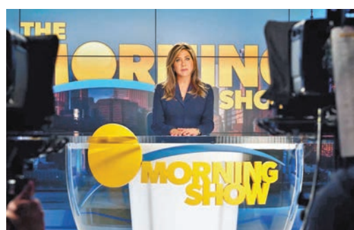
珍妮花安妮絲頓主演劇集《The Morning Show》。

蘋果公司串流影視平台Apple TV+已進入最後籌備階段，據報平台最快將於11月推出，初期由於媒體庫仍處於充實內容階段，所以會有免費試用期，之後才正式收費，估計約為每月9.99美元(約