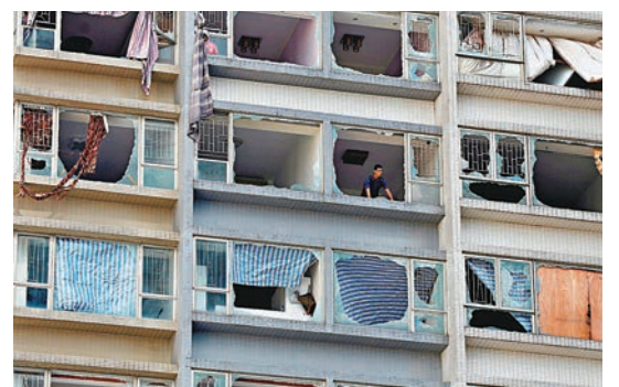
颶風「天鴿」吹襲澳門後，有樓宇玻璃幕牆被毀。資料圖片

近年香港人最熟悉的「風洞效應」例子，莫過於2017年颶風「天鴿」吹襲澳門，導致豪宅寰宇天下多個單位玻璃被吹爆，專家當時指出，由於寰宇天下2007年落成後，向海對出的位置新興建了5座高層屋苑，結果當颶風吹襲時，強風在前方屋苑形成「風洞效應」，令寰宇天下遭到超出官方規定可承受的超強風力吹襲。