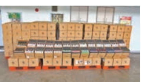
海關在文錦渡管制站檢獲約25萬支沒有進口許可證的電子煙，估計市值約1,280萬元。

香港文匯報訊(記者 蕭景源)香港海關8月17日在文錦渡管制站檢獲約25萬支沒有進口許可證並懷疑含尼古丁的電子煙，估計市值約1,280萬元。 海關人員當日下午在文錦渡管制站截獲一輛入境貨櫃車，經檢查後，在車上的516個紙箱內發現該批電子煙。58歲男司機被捕。案件仍在調查中。