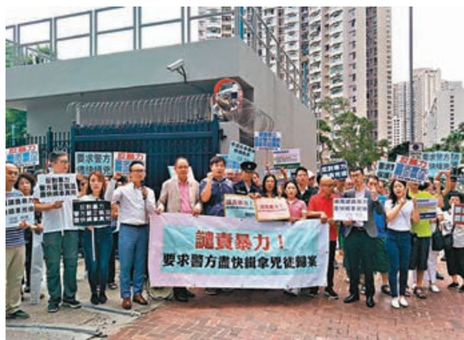
民建聯、工聯會、新民黨等代表昨晨到將軍澳警署請願，呼籲各界「放低暴力、放低仇恨」。

據警方調查顯示，疑兇為嘉明閣住客，警方曾搜其住所但發現屋內無人，相信他在凌晨時分經馬洲返回內地，警方找到其母親，其母致電疑兇勸其返港。至昨日下午3時，疑兇經羅湖返港時被扣查，重案組到場將他押回住所搜證，檢走一個皮包和一條短褲，初步調查事發時他會飲酒。