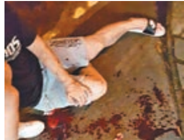
一名男子阻止時亦被斬傷。