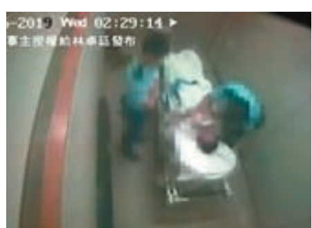
事主公開片段，聲稱曾被警員掌摑、電筒強光射眼、拗手指等。

警察公共關係科總警司謝振中表示，事主兒子6月底向灣仔警署投訴科投訴，警方轉交由新界投訴科跟進，於6月底至8月初先後4次嘗試聯絡投訴人未果。不過，投訴科仍進行了初步調查，包括找到事發時警員當值記錄，確定當時值勤的4名警員。由於根據一般情況，病房內不會設有閉路電視，故投訴科並未聯絡醫院要求翻查，院方也沒向警方透露有這段視頻，相信這段視頻是特別病房內的隱蔽鏡頭所攝。