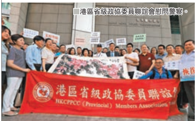
港區省級政協委員聯誼會慰問警察。

香港文匯報訊（記者子京）香港多個愛港社團昨日分別到灣仔警總和多區警署慰問警隊。他們指出，面對持續的暴力示威以至衝擊，警隊克制、專業、勇敢，並讚揚警隊守衛香港、守護市民，是堅如磐石的香港之盾，並對警方辛勞和付出表示感謝。他們強調，將全力支持香港警察止暴制亂，依法嚴懲暴徒。