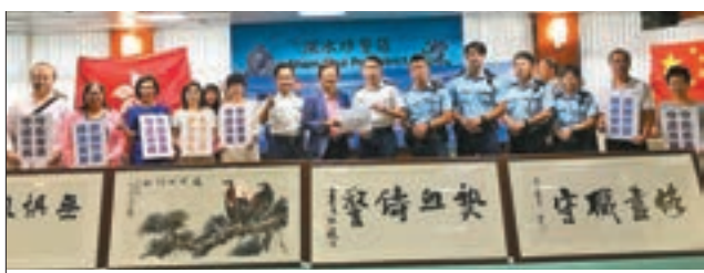
蘇州各旅港同鄉社團慰問警察。