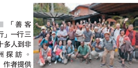
「善客行」一行三十人到非洲探訪。

在整個探訪中，我發覺她們樂安天命，簡單的日子過得蠻快樂，尤其當她們齊唱國歌的時候，那份認真和激情真教人感動，我相信只要國民對國家信任和愛戴，各自做好本分，無論現階段是貧窮還是小康，未來一定更富強！