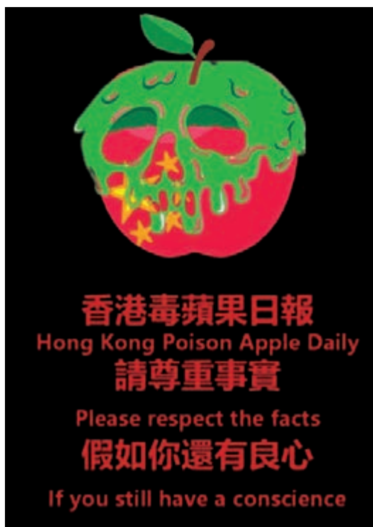
帝吧官微懲戒「蘋果」 訓斥「港獨」。

有媒體注意到，16日晚，@帝吧官微 就以「雖千萬人，吾往矣」開篇發佈出征預告，不但強調了「堅決支持香港警察依法拘捕暴徒」、「理性傳遞中國青年的聲音」等注意事項，還接連公佈16個qq群號，提醒網友「敬請關注官微通知」。這條出征通知隨即獲得了眾多網絡大V的支持。出征前15分鐘，@帝吧官微公佈了「第一戰場」——到海外社交平台 Instagram 聲援「飯圈女孩」。 其間，組織人員根據實時情況，推測激進示威者