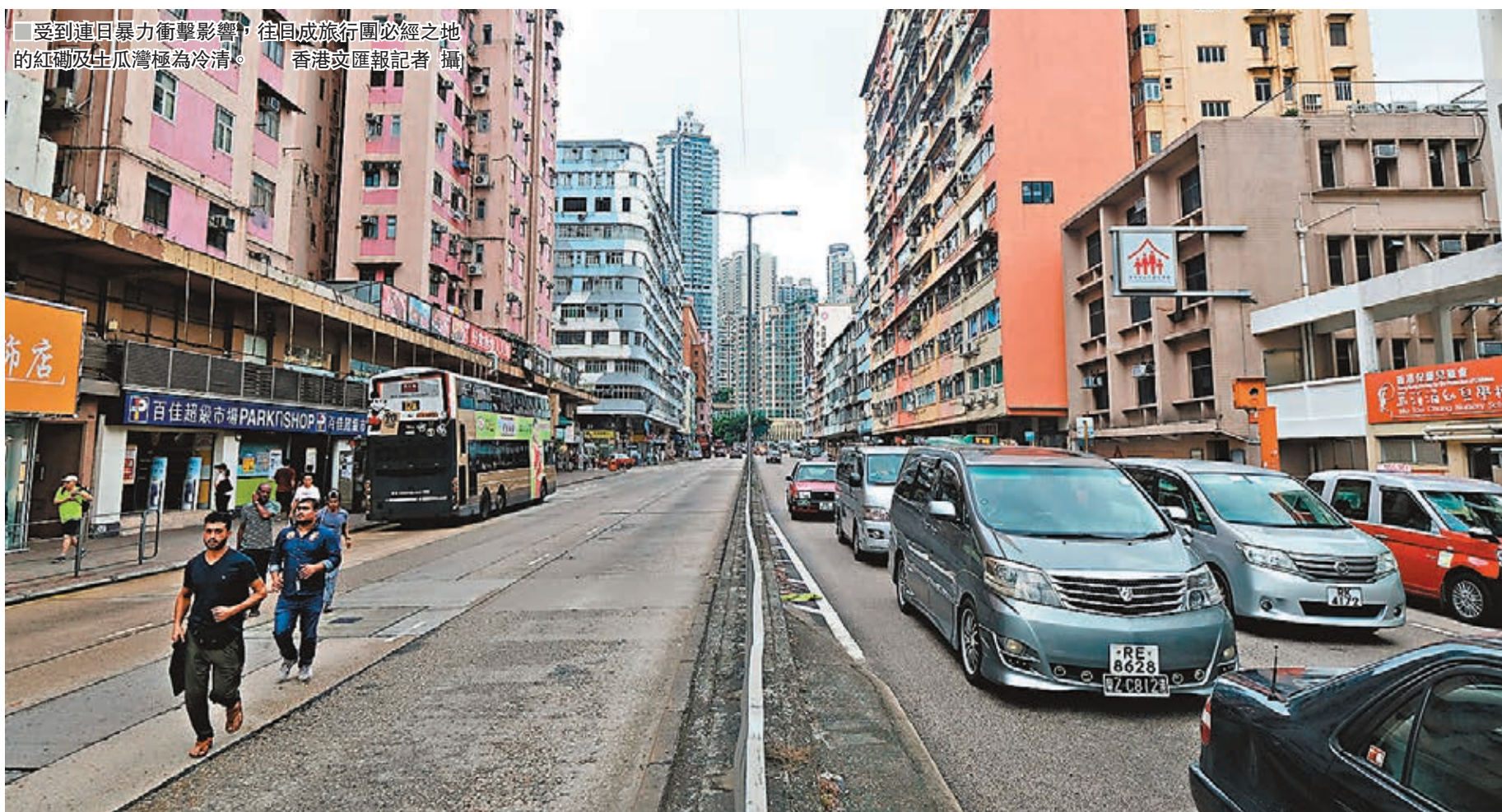
受到連日暴力衝擊影響，往日成旅行團必經之地的紅磡及土瓜灣極為冷清。

香港文匯報記者其後再到土瓜灣視察，情況跟紅磡一樣。主打團餐的酒樓在午市時段門可羅雀，只有零星顧客光顧。酒樓職員張先生直言，受到示威、暴力衝擊影響，生意大跌八成。他未知今日會否開門，慨嘆政治問題應以政治手段解決，和平遊行表達訴求沒有問題，但如今情況如同難為底層的打工仔。