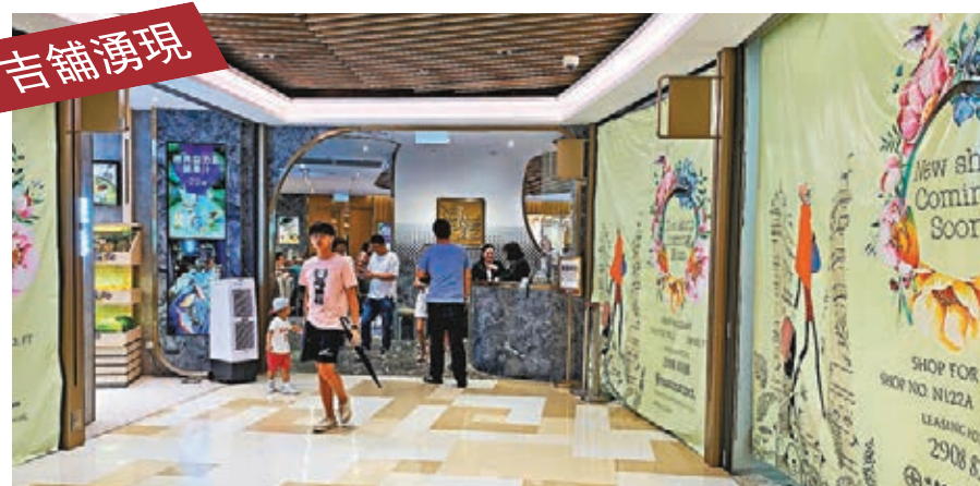
翔龍灣廣場曾是旅行團集中地，惟現今相當清靜。