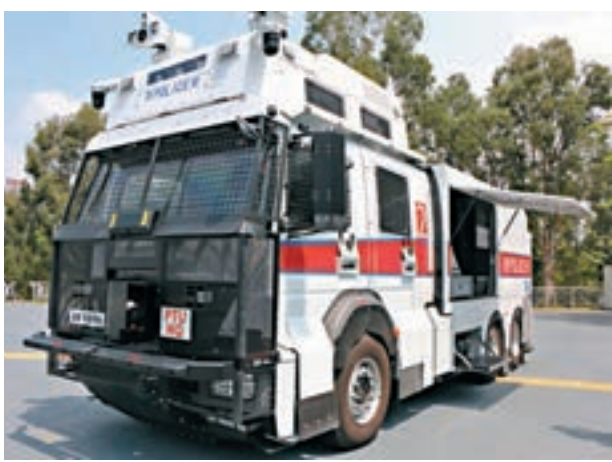
車身左側水缸可添加催淚水劑。