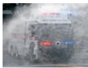
車頭高壓噴嘴，可驅散近距離示威者。