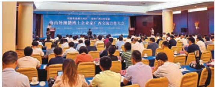
▲海內外潮籍博士企業家廣西交流合作大會現場