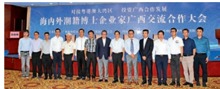
▲海內外潮籍博士企業家廣西交流合作大會嘉賓合影