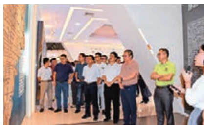
▲考察團參觀南寧市万象新區規劃情況