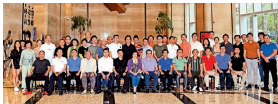
▲考察團在龍光世紀中心進行座談後合影留念

70多位海內外潮籍博士企業家組成的考察團還於7月29日至30日，深入南寧、北海、欽州、崇左4市考察，提供戰略諮詢，促進項目合作。