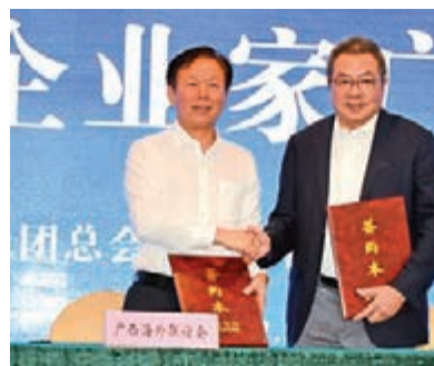
▲廣西壯族自治區黨委常委、統戰部部長徐紹川（左）、香港潮屬社團總會主席陳幼南簽訂交流合作工作備忘錄