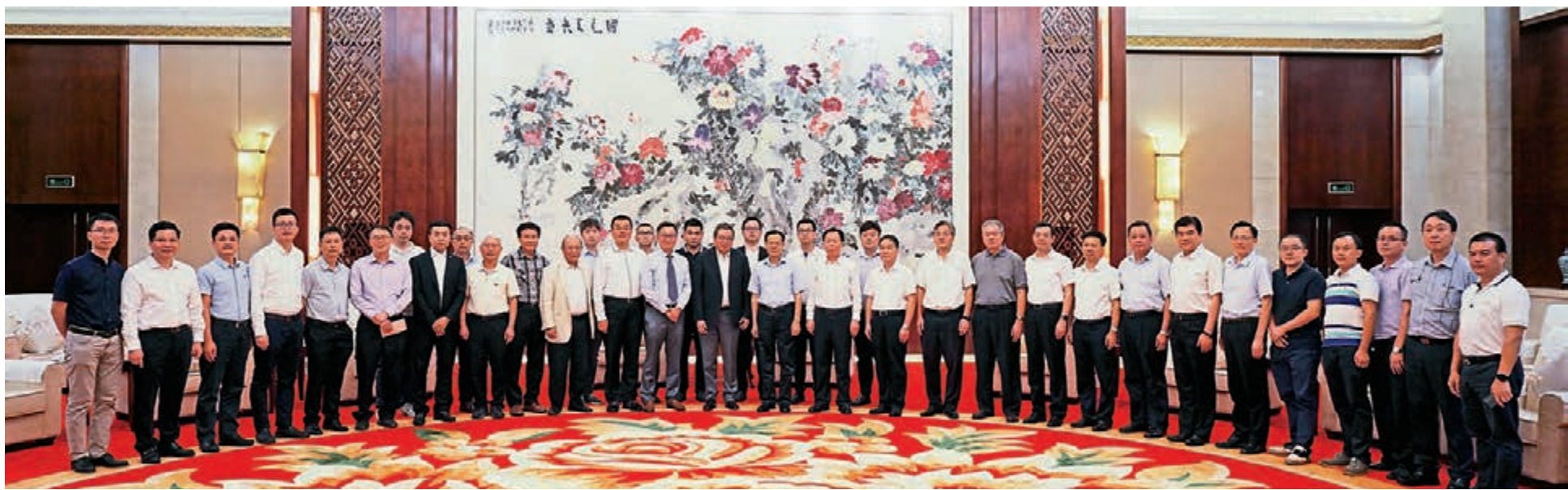
▲廣西壯族自治區主席陳武（前排左13）與海內外潮籍博士企業家考察團主要成員合照

當天的大會議程非常豐富，廣西發改委、科技廳、工業和資訊化廳、商務廳、投資促進局等區直單位負責同志作了投資推介，潮籍博士和企業家9名代表作了精彩發言。廣西海外聯誼會與國際潮籍博士聯