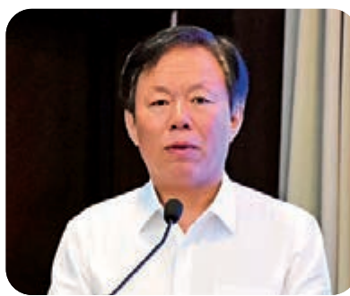
▲廣西壯族自治區黨委常委、統戰部部長徐紹川致辭