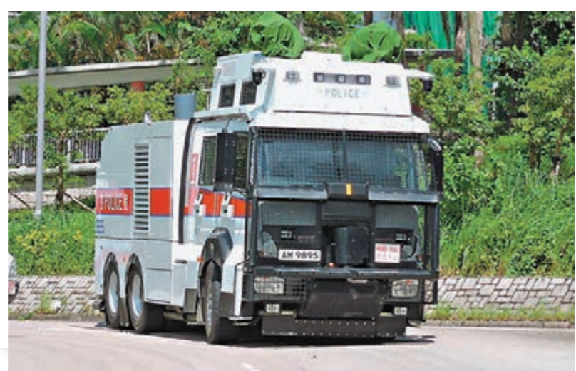
水炮車最快今天會在粉嶺示範，相信短期內水炮車可投入服務。資料圖片

據悉，警方由上月30日已開始頻頻安排警員駕駛水炮車進行路面測試，若測試順利，最快可在本月