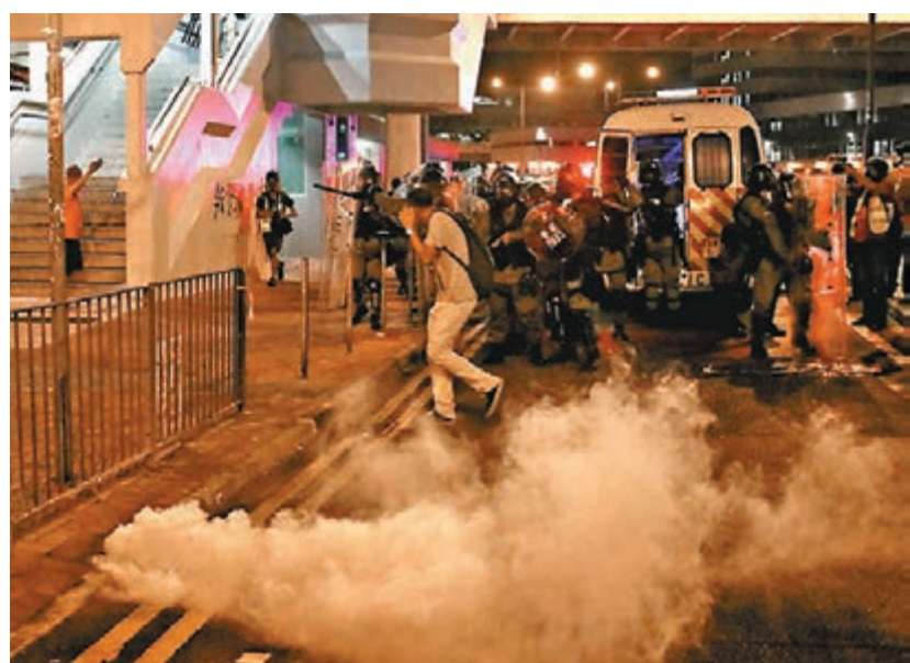
防暴警察將暴徒趕入葵芳地鐵站。