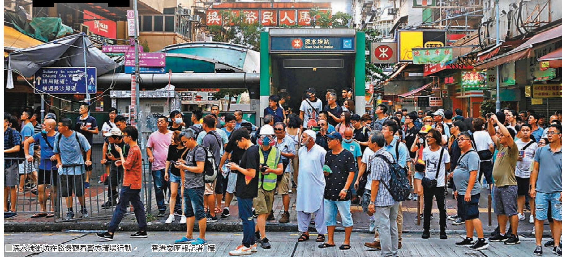
深水埗街坊在路邊觀看警方清場行動。

兩警署內早有準備的防暴警察向口黨舉旗警告後，幾度發射催淚彈，並迅速推進衝口口黨，拘捕數名疑犯，初步擊潰口黨襲擊企圖。