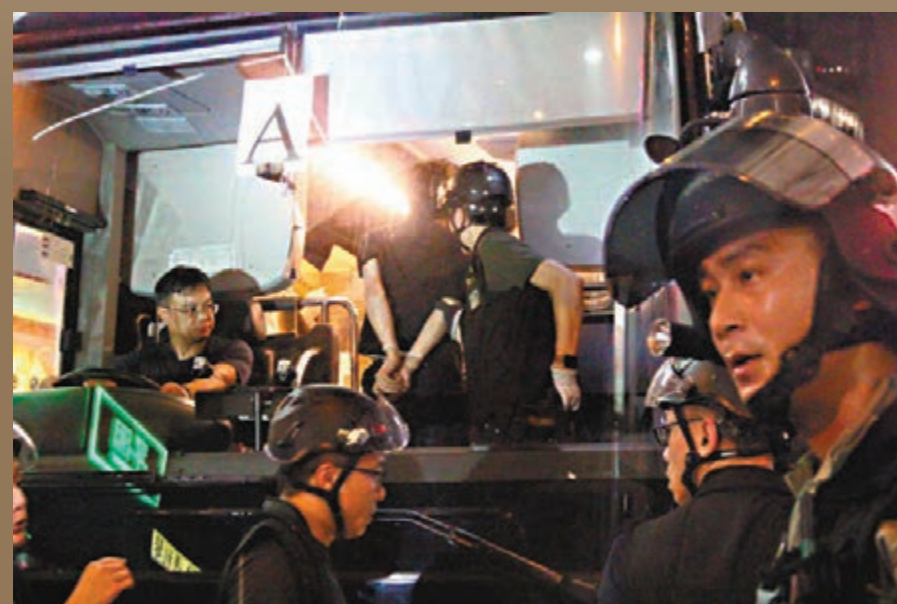
大巴押走被捕暴徒。