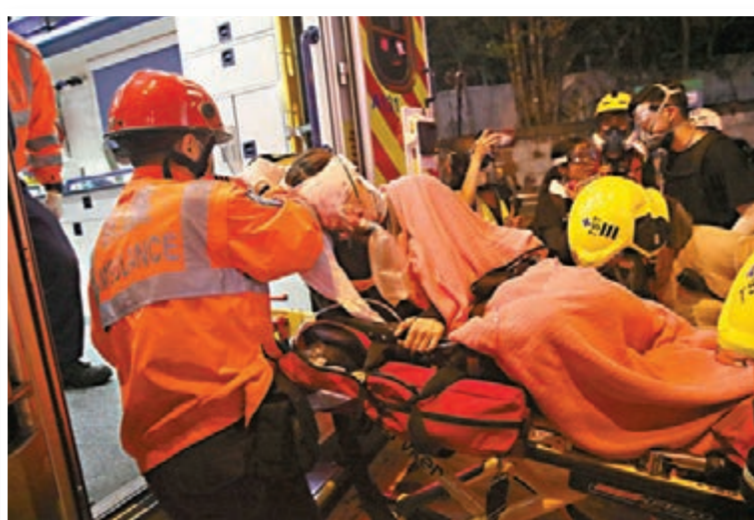
一名女示威者在尖沙咀警署旁頭部中彈送院，後證實眼珠爆裂。