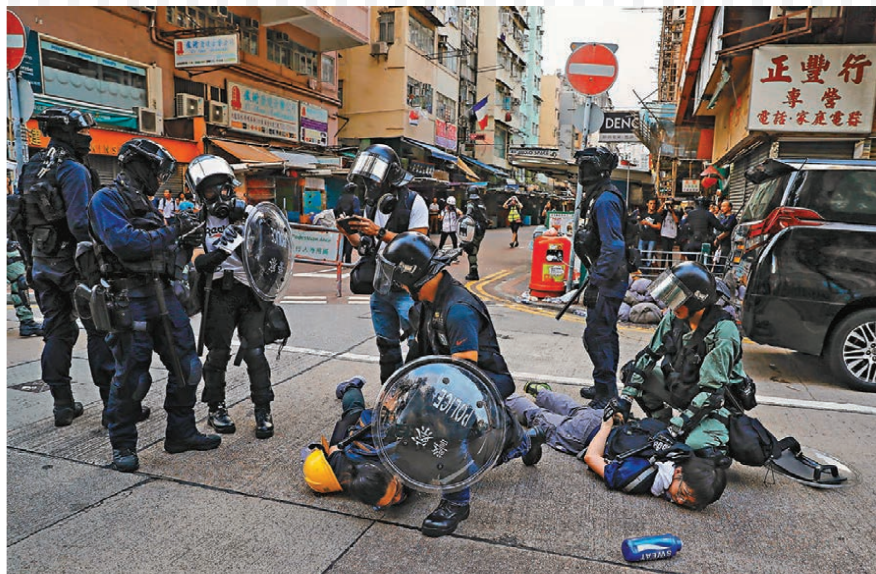
警方在深水埗南昌街近鴨寮街口拘捕兩名暴徒。