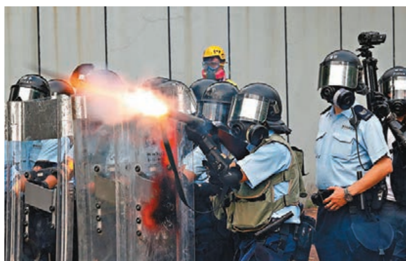
警方向暴徒發射催淚彈。