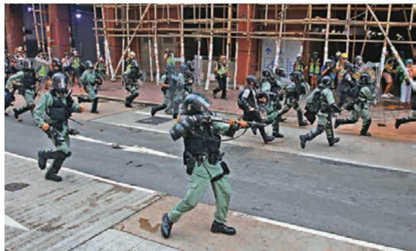
警方在深水埗驅散暴徒。