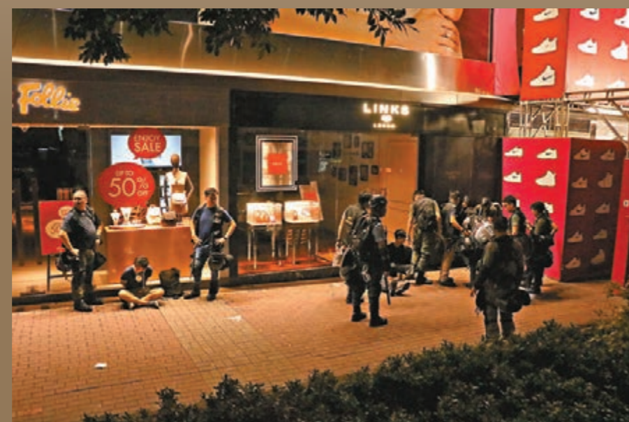
警方在尖沙咀拘捕多名暴徒。