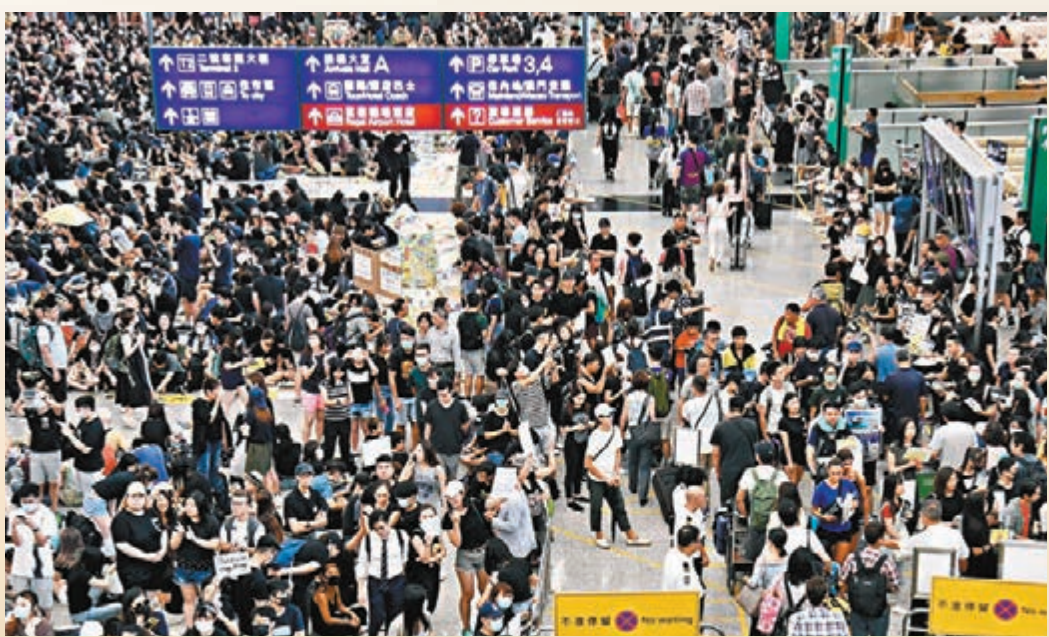
香港國際機場接機大堂繼續有示威者違法聚集。

香港文匯報訊(記者 杜思文、文森)中國民航局因應有國泰航空職員在香港連串暴亂中所擔當的角色,日前發出了對國泰的重大航空安全風險警告,並提出禁止有過激行為者執飛內地航班或執行與內地航空運輸活動相關的一切職務等3項要求。香港縱暴派聲稱此舉是「製造白色恐怖」、「破壞『一國兩制』」云云。香港政界人士在接受香港文匯報訪問時表示,民航局以對安全隱患零容忍為原則,發放航空警告是保護乘客生命安全和國家安全的必要之舉。國泰有員工隨意洩漏他人資料,乘客的私隱得不到保障,才是真正的「白色恐怖」。