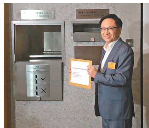
圖為遠東發展代表。

雖然地皮位置優越，但值得留意，政府上半年推出的兩幅商業地皆觸礁，1月截標的啟德第4C區5號地皮流標收場，之後5月截標的啟德第4C區4號地皮雖以逾111億元售出，但中標財團高銀6月時選擇「撻釘」，再加上最近社會不安，令市場一直對昨日截標反應較悲觀。