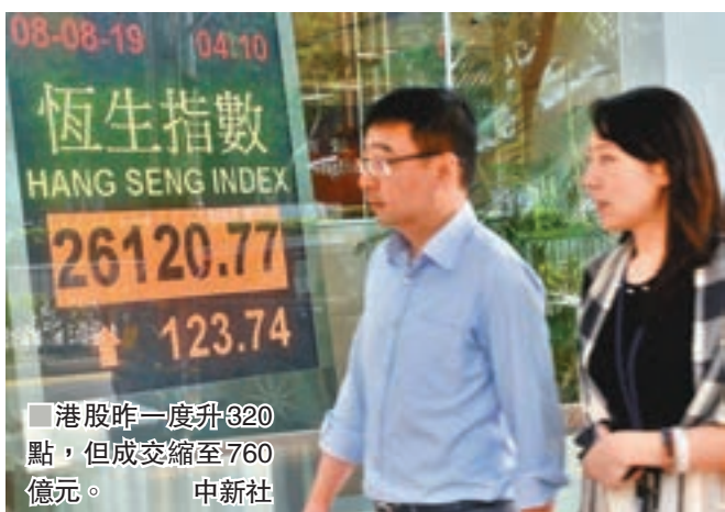
港股昨一度升320點，但成交縮至760億元。

香港文匯報訊(記者 周紹基)MSCI明晨公佈將A股納入因子由10%提升至15%，將在8月27日收市後生效，這意味逾百億資金將要買入A股，利好市場氣氛。此外，人民幣中間價較預期高，內地出口數據亦優於預期，紓緩了市場對貿易戰影響增加的憂慮，恒指昨日最多升過320點，收報26,120點，升123點，但交投回落，只有760億元，反映投資氣氛不濟，加上20天跌穿50天線，技術上出現「死亡交叉」，預示港股進入中期調整。