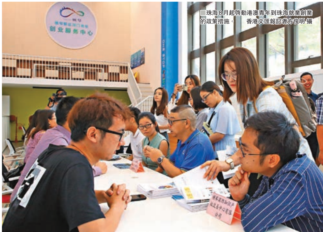
■珠海8月起啓動港澳青年到珠海就業創業的政策措施。

為加快提升自主創新能力,參與大灣區國際科創中心建設,珠海新發佈《珠海市貫徹落實「省科技創新十二條」政策實施細則》。市科創局有關負責人6日受訪時指出,針對與港澳科創合作出臺6條開放性措施,旨在「在更高水平上擴大開放,促進人往來、