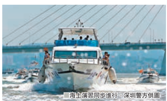
■海上演習同步進行。