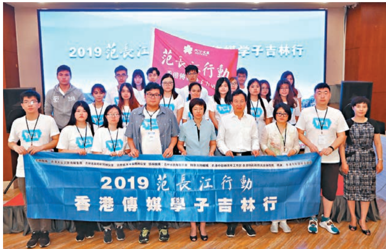
「2019范長江行動—香港傳媒學子吉林行」7月31日舉行啟動儀式。

香港文匯報訊(記者盧冶吉林報道)「2019范長江行動—香港傳媒學子吉林行」活動近日舉行了啟動儀式。來自香港大學、香港公開大學、香港浸會大學、香港城市大學、香港樹仁大學、香港理工大學、香港科技專上書院、香港專上學院等8所高校的15名傳媒專業的青年學子,和東北師範大學的4名學生一起,在7月28日至8月3日期間參訪考察吉林省多個地區,深入了解吉林省緊隨國家改革開放步伐大前行的歷程和翻天覆地的變化,領略吉林22°C的清爽夏天和濃郁的北國風情。