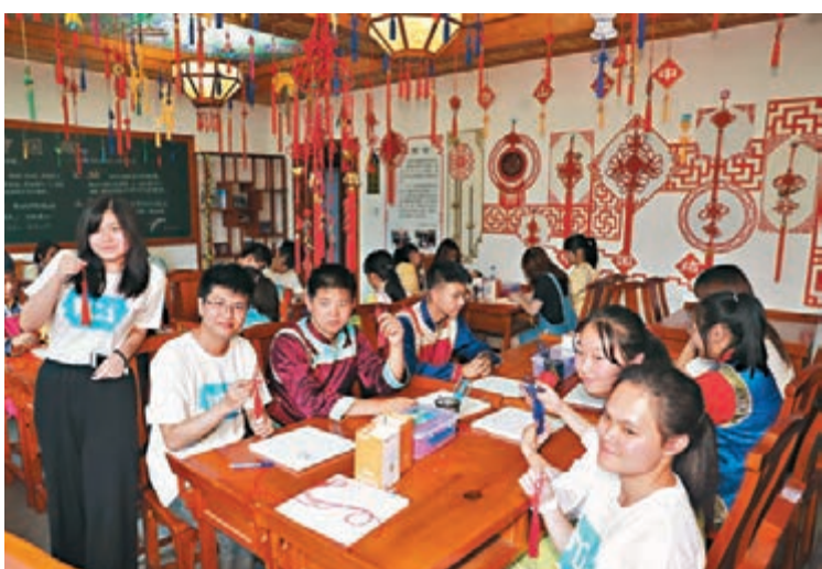
在滿族學堂,兩岸學子共同學習剪紙、打中國結。

活動中,同學們來到抗日英雄楊靖宇將軍殉國地,跟隨講解員的腳步了解楊靖宇將軍犧牲前後118個小時的壯烈故事。