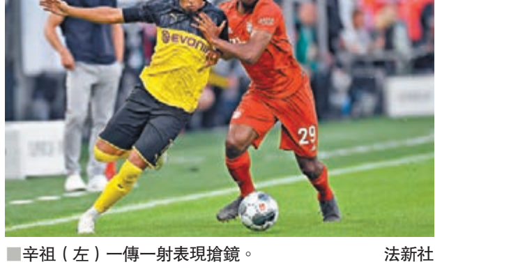
辛祖(左)一傳一射表現搶鏡。