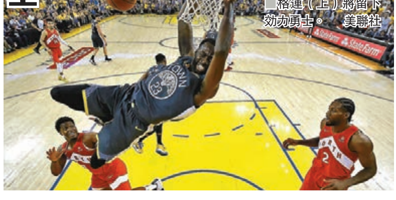
格連(上)將留下効勁勇士。

格連簽下這份延長合約，勇士下季搬進舊金山造價10億美元的新場館後，將有羅素、居里、湯遜及格連4名明星球員在陣中。 ■中央社