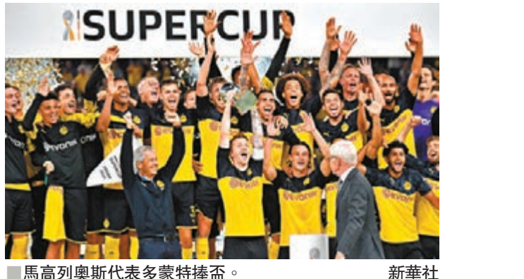
馬高列奧斯代表多蒙特捧盃。新華社

賽後，拜仁教練尼高華表示：「我們應該更有效地利用機會，而不要讓多蒙特發揮他們擅長反擊的特點。雖然拜仁今天談不上踢得很好，但表現還算中規中矩。我們在場面上佔據主動和優勢，但被多蒙特利用了我們的兩個失誤。」 ■新華社