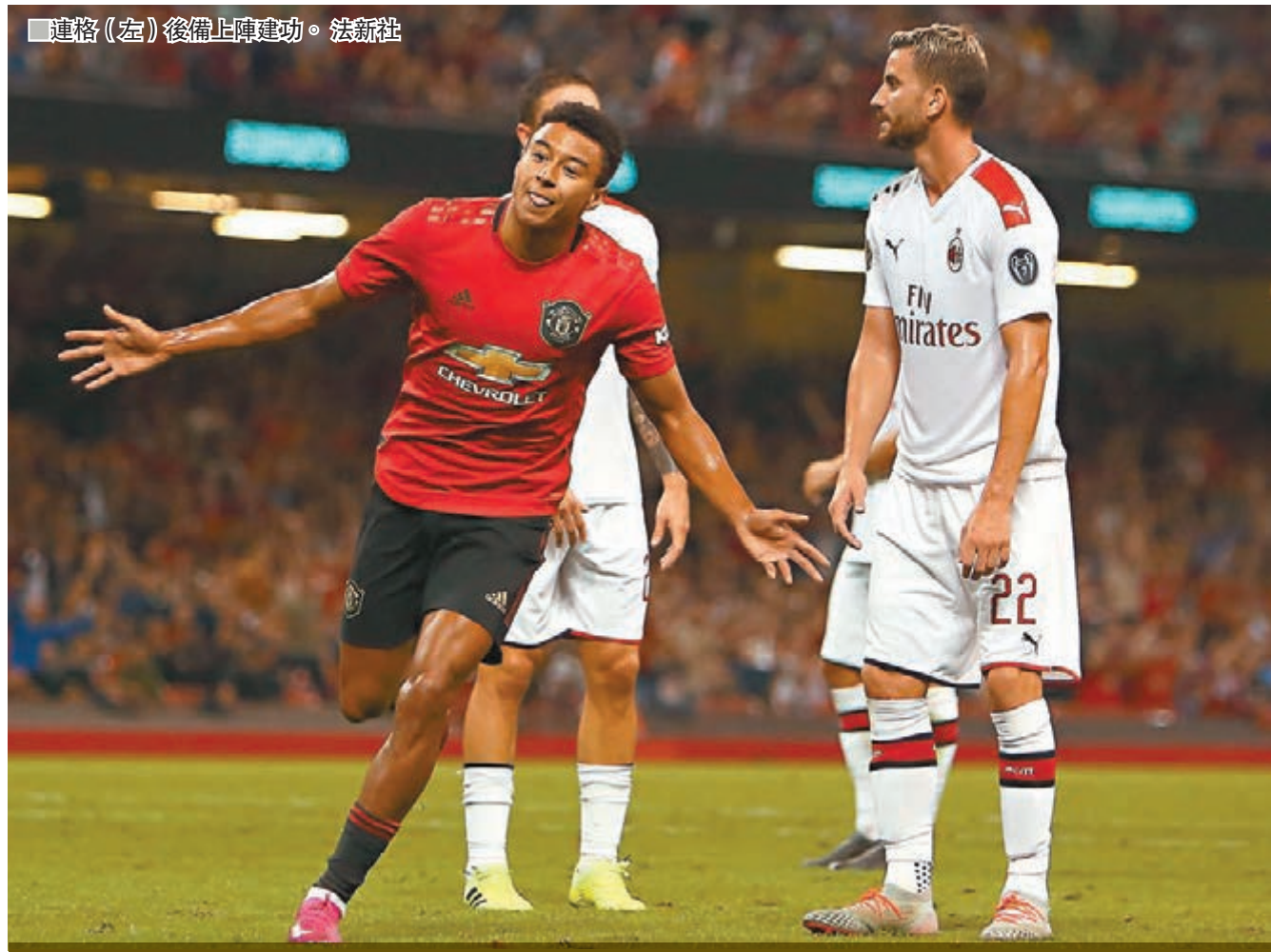
連格(左)後備上陣建功。