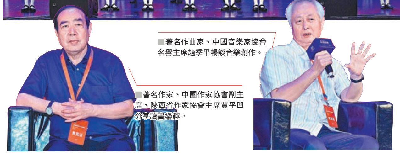
■著名作曲家、中國音樂家協會名譽主席趙季平暢談音樂創作。