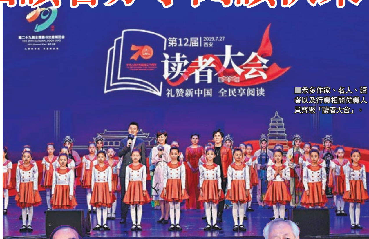
■眾多作家、名人、讀者以及行業相關從業人員齊聚「讀者大會」。