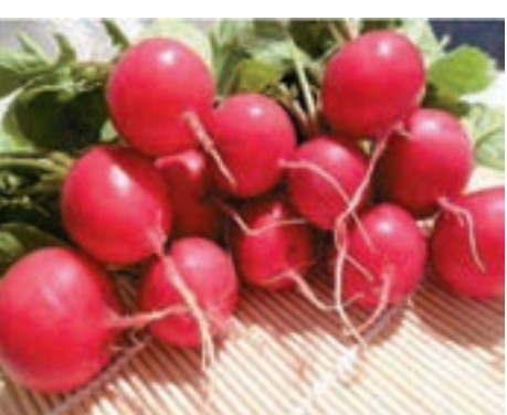
■櫻桃蘿蔔既好吃又富生活情趣。

櫻桃蘿蔔很有生活情趣，也很入畫。不知什麼緣故，畫櫻桃蘿蔔的畫家不多。其實事無鉅細，物無大小，均可入畫。餐飲界有句話，大廚手中無廢料。在好的大廚手中，任何葷的素的原材料，哪怕是邊邊角角的下腳，經過加工，均可做成美味佳餚。有些人就喜歡挑挑揀揀，追求所謂的重大題材，注重熱門的題材。我覺得這是對生活的一個忽略，對題材的一個偏頗。試想，齊白石就沒有畫過重大題材，羅中立的油畫《父親》，也不過是個鄉村老漢的真實寫照。大凡書畫，包括寫作的人，只要能言志抒情便可。創作之際，有時另闢蹊徑，別具匠心，反倒容易成功。