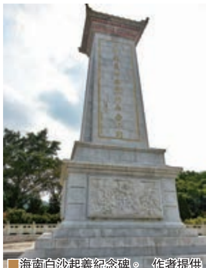
■海南白沙起義紀念碑。

今天的白沙起義紀念碑，位於瓊中縣紅毛鎮的白沙起義紀念園裡。紀念園內除了紀念碑，還有紀念館、紀念雕塑牆和王國興塑像等紀念設施。空間開闊，環境優美。主體建築紀念碑，用花崗岩鑄成，高17米多。正面鐫刻着江澤民同志於1991年5月10日題寫的「白沙起義的英烈們永垂不朽」12個大字，背面刻有白沙起義簡介。引人矚目的起義雕塑牆，長33米，高3米，於2010年建成，用雕塑作品生動再現了當年白沙起義黎族勇士的英雄形象，震撼人心。佇立於紀念碑前，我深深領悟到，中國人民今天的自由生活，是漢族、黎族、苗族等56個中華民族浴血奮戰換來的，我們永遠不忘初心，不應忘記老一輩革命家和億萬祖先付出的血的代價，建立的豐功偉績。