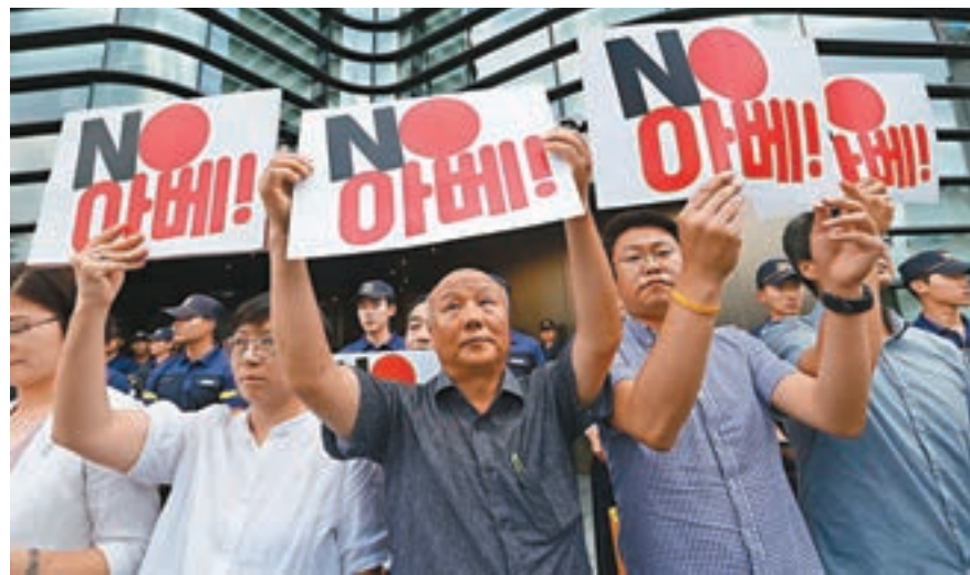
示威者舉起印有「不要安倍」的標語牌。