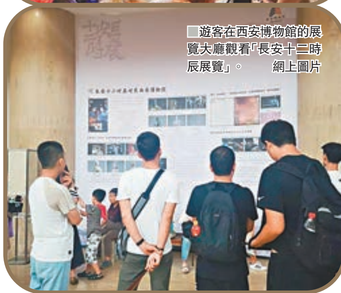
遊客在西安博物館的展覽大廳觀看「長安十二時辰展覽」。