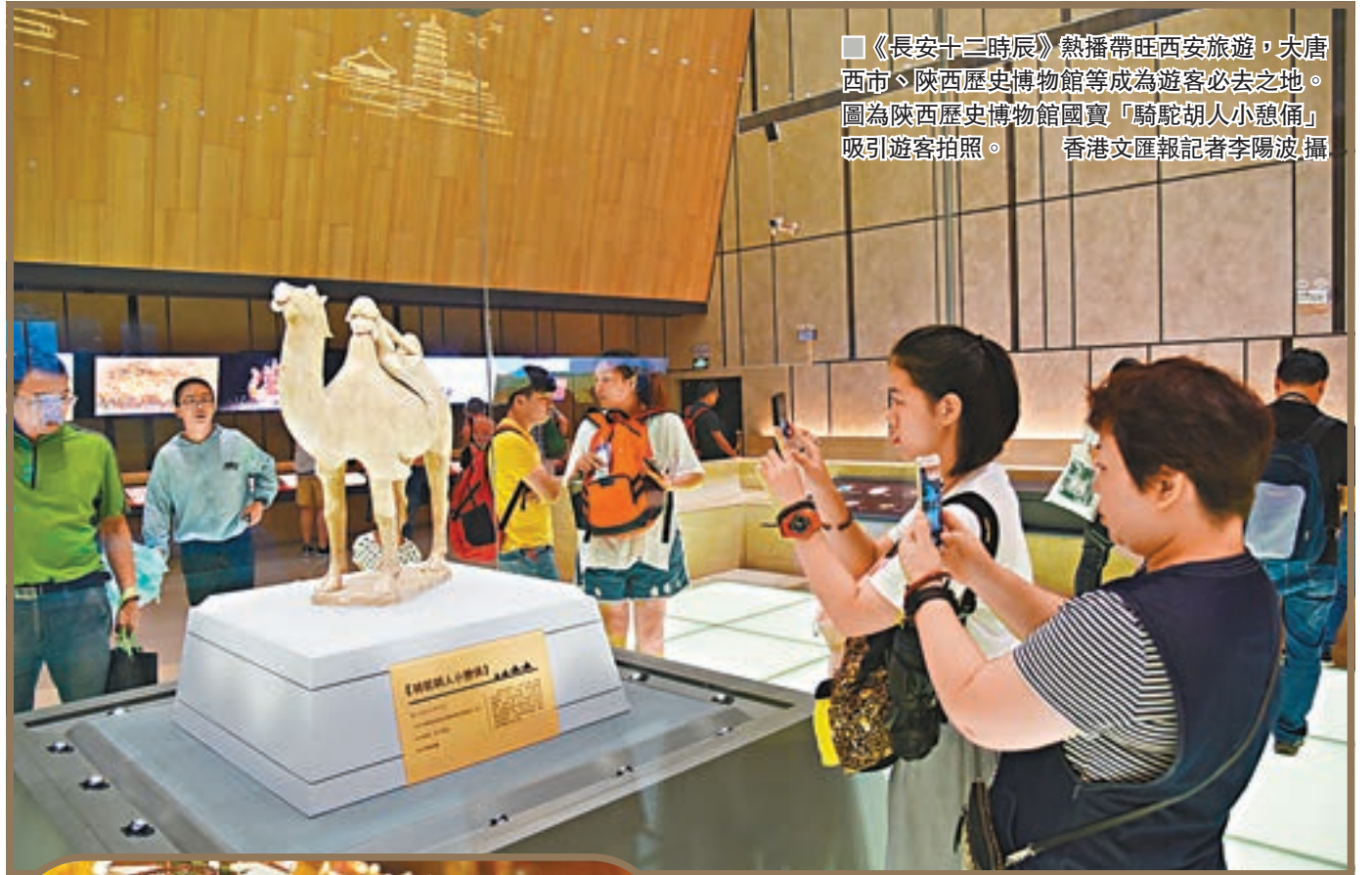
《長安十二時辰》熱播帶旺西安旅遊,大唐西市、陝西歷史博物館等成為遊客必去之地。圖為陝西歷史博物館國寶「駱駝胡人小憩俑」吸引遊客拍照。

據內地多個旅遊平台數據顯示,截至目前,西安的旅遊訂單數還在急劇增長。為應對越來越多的參觀者,西安部分博物館宣佈延長開放時間,同時增加夜場,陝西歷史博物館等則開啟限流措施。