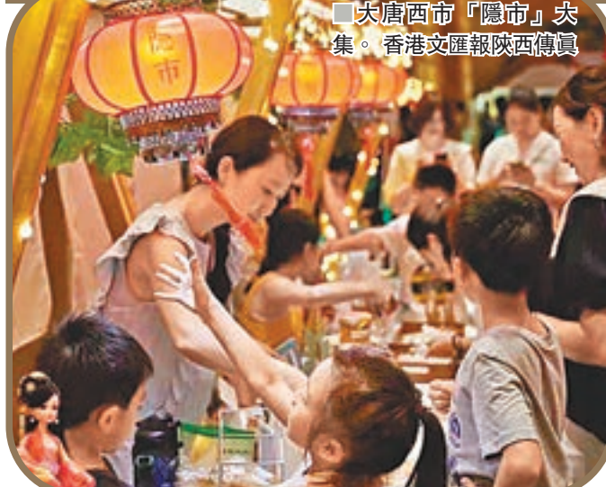
大唐西市「隱市」大集。香港文匯報陝西傳真