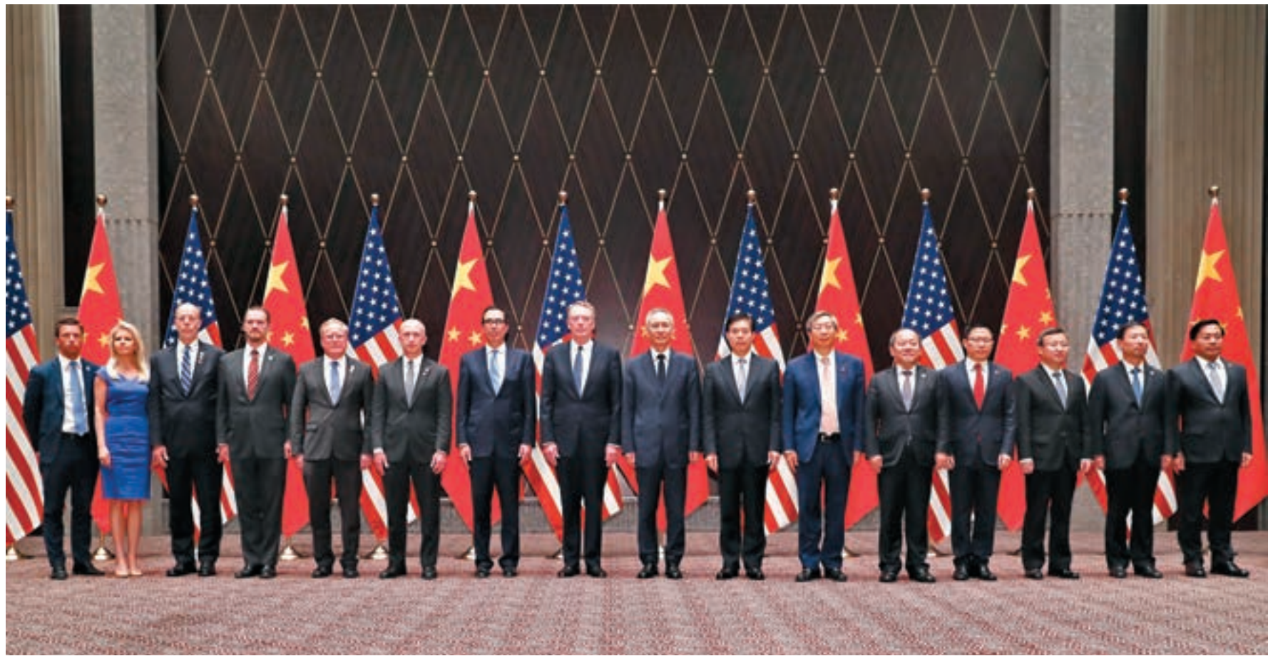
7月30日至31日，劉鶴（右八）與美國貿易代表萊特希澤、財政部長姆努欽在上海舉行第十二輪中美經貿高級別磋商。