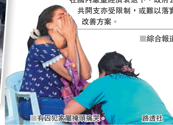
有囚犯家屬掩頭痛哭。