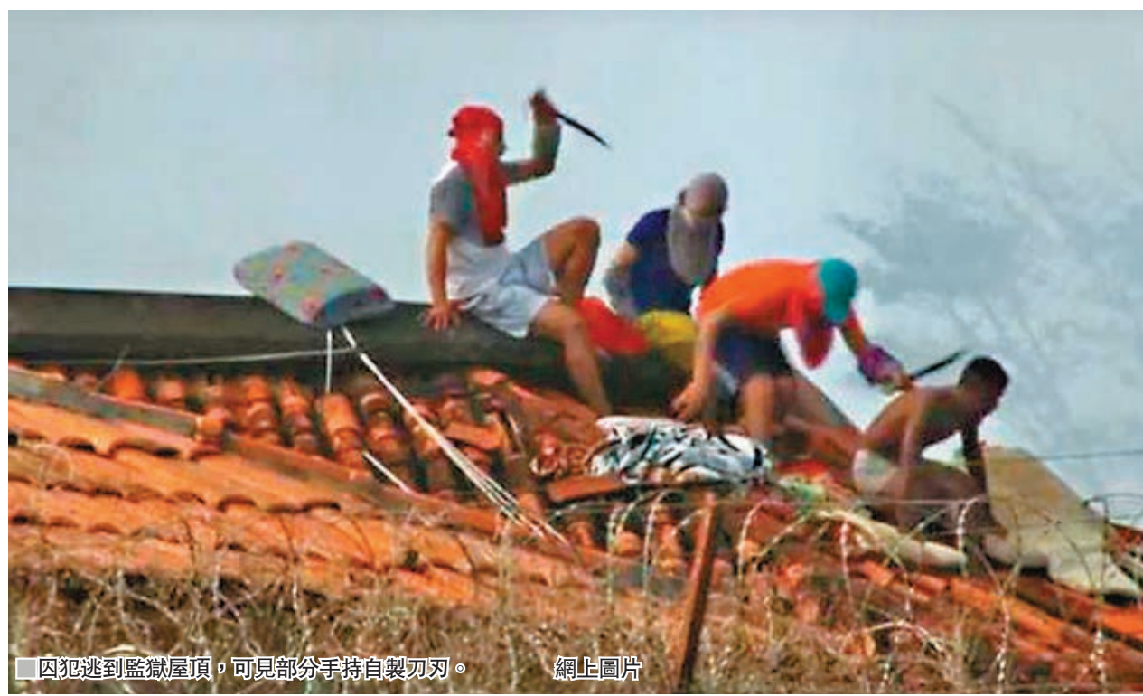
囚犯逃到監獄屋頂，可見部分手持自製刀刃。