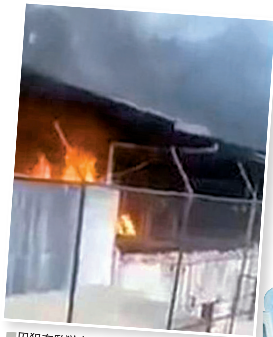
囚犯在監獄中放火。