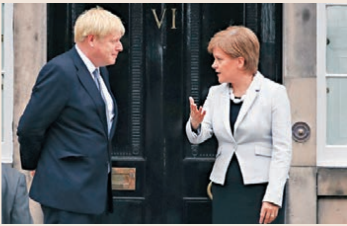
施雅晴批評約翰遜無意與歐盟達成新協議。