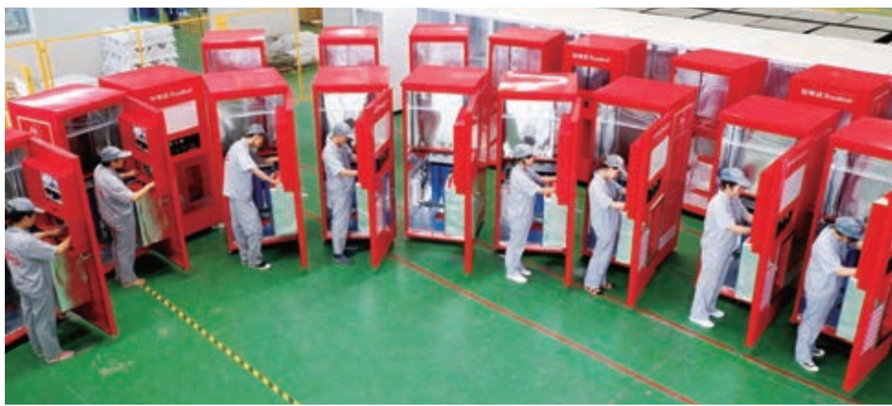
榮事達生產車間，工人正在加緊生產出口到柬埔寨的淨水設備訂單。

「一帶一路」倡議為中國企業拓展市場提供了更為廣闊的舞台。合肥榮事達水工業設備有限公司的智能直飲一體機、物聯網智能自動售水機、大型水處理設備等產品近年來紛紛走向海外市場，先後與馬來西亞、柬埔寨、贊比亞、智利等「一帶一路」沿線國家建立合作關係。今年上半年，該公司淨水設備貿易出口逾2,370台，同期增幅達50%。