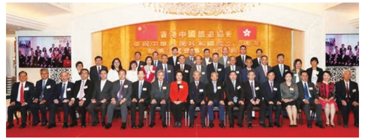
香港中國旅遊協會隆重舉辦慶祝70周年國慶暨第18屆理事會就職典禮，賓主合照。

7月25日，香港中國旅遊協會隆重舉辦慶祝中華人民共和國成立70周年暨第18屆理事會就職典禮。中聯辦副主任仇鴻、經濟部部長孫湘一，外交部特派員公署副特派員宋如安，行政會議召集人陳智思，商務及經濟發展局副局長陳百里，運輸及房屋局副局長蘇偉文，旅遊事務專員黃智祖，中國旅遊集團董事長黃敏，港區人大代表、協會會長盧端安，立法會議員姚思榮，香港旅遊業議會主席黃進達，香港旅遊業界商會主席等嘉賓應邀出席。典禮上，300多位賓客濟濟一堂，把酒言歡，為國家取得的輝煌成就感到鼓舞和自豪。協會理事長吳熹安致辭、姚柏良副理事長致謝辭。吳理事長表示協會將承先啟後、繼往開來，與會員共同努力促進內地和香港旅遊事業的發展，支持林鄭特首和特區政府依法有效施政。