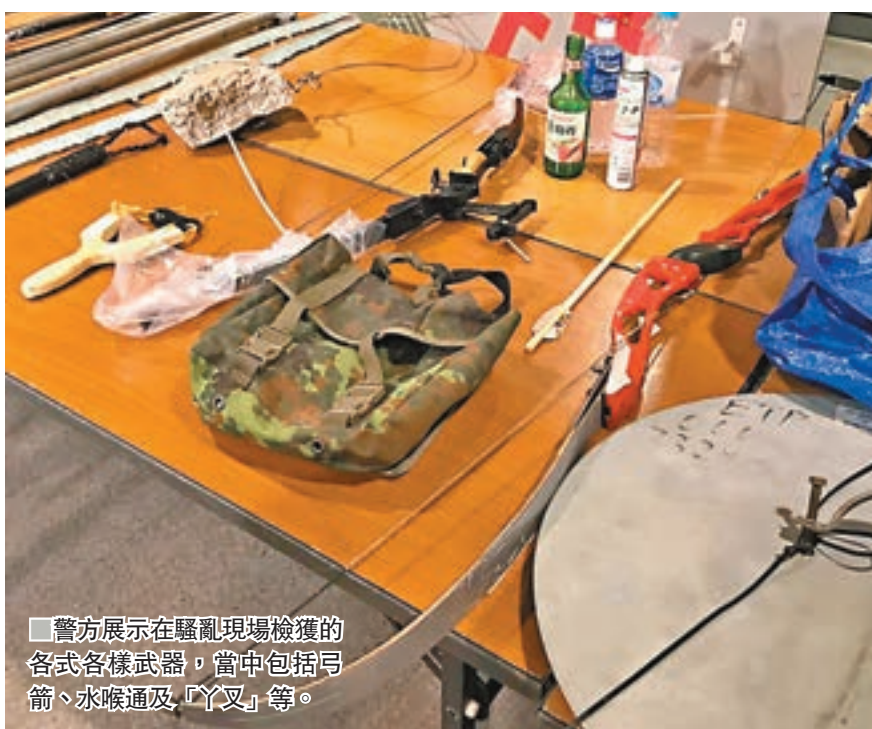
警方展示在騷亂現場檢獲的各式各樣武器，當中包括弓箭、水喉通及「丫叉」等。