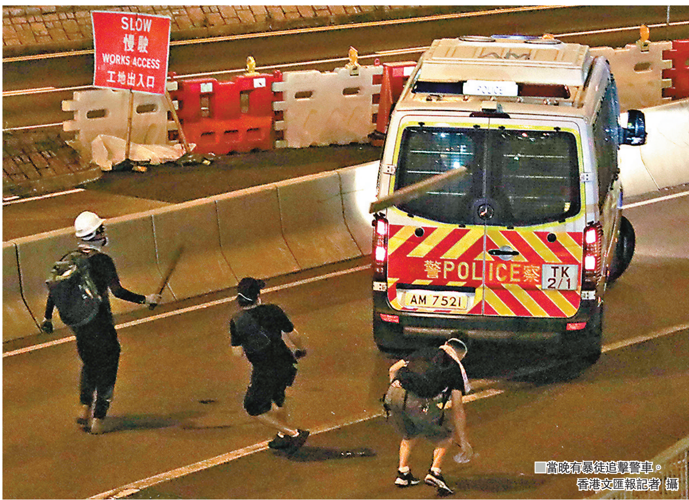
當晚有暴徒追擊警車。

另外，警方表示，為減低由示威活動演變的衝突而使用的催淚煙會影響到附近居民。因此於行動前已與警署一帶的管理處、酒店及商戶聯絡，以便相關人士盡早作出相應安排。行動期間已與附近安老院聯絡，並於社交媒體及新聞公報提醒附近居民關好門窗及避免前往相關地方，留在室內地方，保障自身安全。