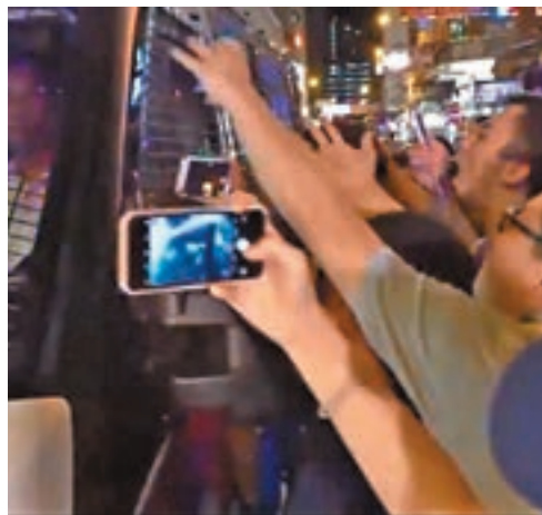
▲警員調查期間遭多名市民粗口辱罵，警車更被包圍。