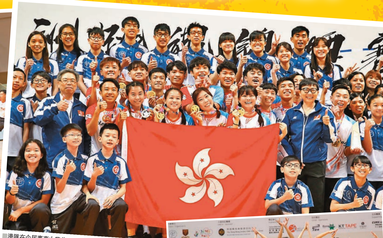
港隊在今屆賽事大豐收。

至於為其他本地參賽者而設的總會盃方面，中學組由Jumper奪冠，香蕉與文西則勝出公開組。