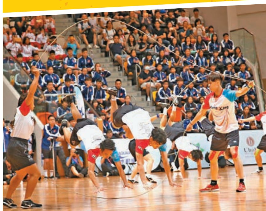
港隊最後一天再下一城。

香港文匯報訊（記者黎永淦）一連四日的「第10屆亞洲跳繩錦標賽」昨午圓滿落幕，香港隊在煞科的表演盃大熱封王，總結今屆共贏得31金37銀32銅共100面獎牌，比上屆多出9塊，保住「亞洲一哥」威名。