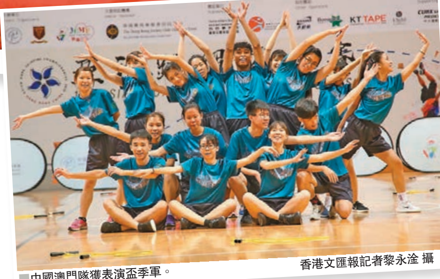
中國澳門隊獲表演盃季軍。