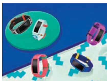
Fitbit Ace 2 設有多色選擇

穿戴裝置品牌 Fitbit 早前推出 Ace 2，幫助 6 歲以上的孩童自幼建立健康習慣，並鼓勵他們花更多時間與家人和朋友一起探索做運動的樂趣。Ace 2 採用全新的防水設計，方便進行水上活動時配戴，並有防撞邊以保護屏幕，令其在孩子全日玩樂後也不怕損毀。而且，家長必須建立一個 Fitbit 家庭賬戶，以利用孩子的賬戶設置 Ace 2，協助他們檢視孩子的活動情況。