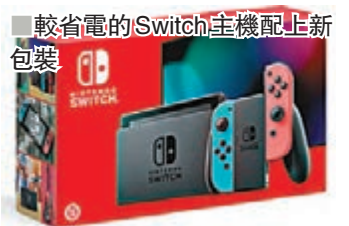
較省電的 Switch 主機配上新包裝

任天堂熱賣家用平台 Switch 動作多多，繼不久前公佈將推出較輕巧的純手提版 Switch Lite 後，現表示會為可接駁電視輸出的基本版加添電力，讓機迷帶它出街玩時能有更強續航能力。據了解，廠方未有升格內藏電池，只是替處理器和記憶體升級，但已能延長約一半運行時間，且售價不變同為 HK$2,340，有意近日出機者緊記別買錯型號。「省電版」Switch 於下月 1 日起在港發售，同樣備有藍靛紅和灰兩種配色，但包裝盒改以紅色為主，令人一目了然。老任亦於 10 月推出兩款全新配色 Joy-Con。 在遊戲方面，剛推出《哆啦 A 夢牧場物語》中文版的 Bandai Namco 日前發表於 10 月 10 日發售移植自大熱手機遊戲的《迪士尼 Tsum Tsum 嘉年華》，基本模式依舊是在類似扭蛋箱的空間內消除得意轉轉球，為增添可玩性廠方追加了為數不少的小遊戲。另外首批顧客更可獲「嘉年華米奇」等共六款原創 Tsum 的下載碼；在日本甚至推出精美暗花圖案限定主機。而老任也會在下月 9 日推出《俄羅斯方塊 99》實體版。