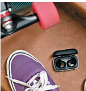
ADVANCED Model X

源自美國的高級耳機品牌 ADVANCED，其 Model X 真無線耳機正式抵達香港，它採用 10mm 石墨烯驅動單元，能提供精細的高傳真音頻，並採用藍牙 5.0 技術，令耳機具備穩定的接收能力。耳機管口設計深入耳道深處，配合符合人體工學的緊貼設計，實現高達 23dB 最大隔音距離。它具 5 小時連續使用時間，配備充電盒的續航時間達 25 小時，結合快速充電，實現全天候便攜式耳機的理想。同時，它亦達 IPX5 防水規格，使用家能在日常生活及運動中，享受高質無噪的音樂體驗。