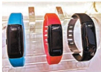
VIFIT MX3 CONNECT