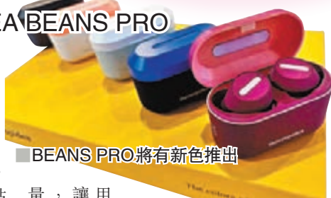
BEANS PRO 將有新色推出

主打型格潮流創意注入生活產品中的香港數碼產品品牌 THECOOIDEA，於上年推出品牌第一對「粉色」的 True Wireless 入耳式耳機 BEANS，今年再度推出新一代的真無線藍牙耳機 BEANS PRO，並將於下月初推出新色。耳機外殼同樣使用人體工學設計更能緊貼亞洲人的耳窩，更加上 IPX7 防水防汗等級的認證，讓 BEANS PRO 可以媲美運動型真無線耳機使用。