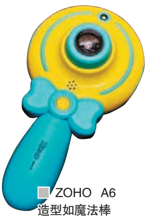
ZOHO A6 造型如魔法棒

暑假來到，也是父母帶孩子出門玩樂，增進親子感情的最好機會。這時候想要用相機記錄成長時刻，與其緊迫着孩子們拍照，不如培養他們對攝影的興趣，用屬於自己的角度看世界。最近 ZOHO 新推出了 A6 兒童數碼相機，可愛的魔法棒造型，打破相機艱深專業的形象，馬上引發孩子們想要使用的興趣。