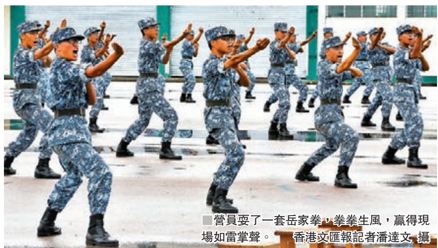
營員耍了一套岳家拳,拳生風,贏得現場如雷掌聲。

她坦言,訓練過程比想像中累,「有很多連續的訓練項目,休息的時間都遵守嚴格規定」,又指剛開始訓練時雙腳都出現「水泡」,猶幸獲軍醫用心照