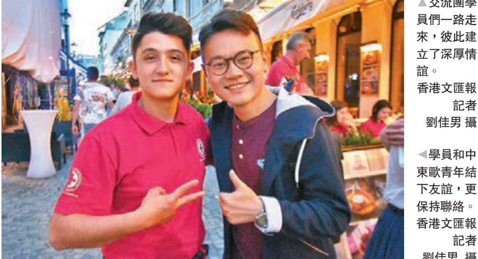
學員和中東歐青年結下友誼,更保持聯絡。