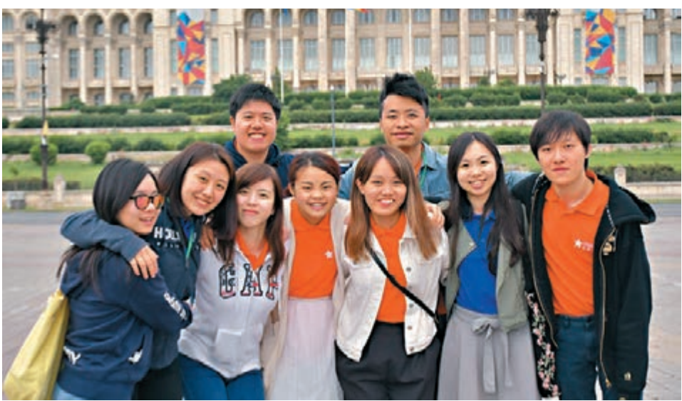
交流團學員們一路走來,彼此建立了深厚情誼。