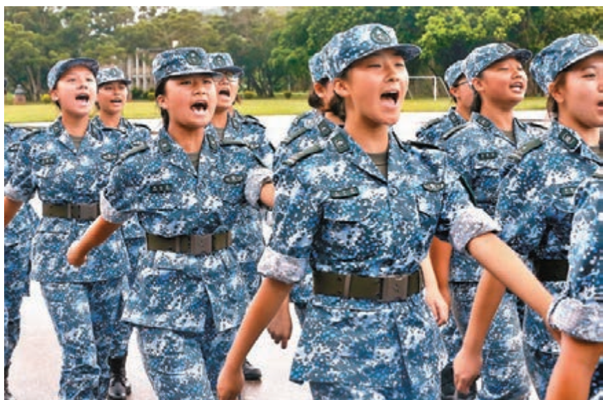
營員們步操走過主席台,眼神堅定、口號鏗鏘有力。