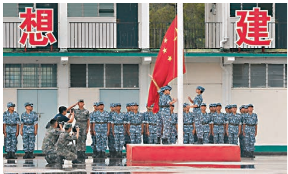
五星紅旗隨奏起的國歌冉冉升起。