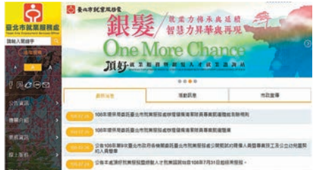
台北市就業服務處官網開設有「銀髮族專區」。

台北市就業服務處官方網站，也開設有「銀髮族專區」，提供包括一對一職涯諮詢服務、銀髮工作職缺開發、推動中高齡者職務再設計的雙向輔導服務。