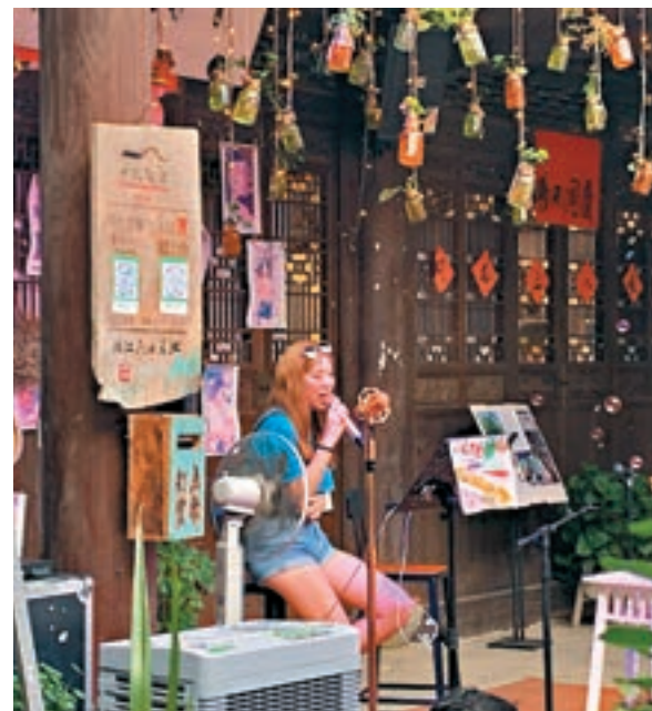
■「未來之星」團友現場一展歌喉。

他告訴記者，在實習中感受最深的是有幸獲邀參加中國香港（地區）商會——浙江的月度活動，通過與居杭港人的交流獲益良多，發現杭州是一個充滿凝聚力的城市，吸引了那麼多香港及海外人士在此創業就業及定居。