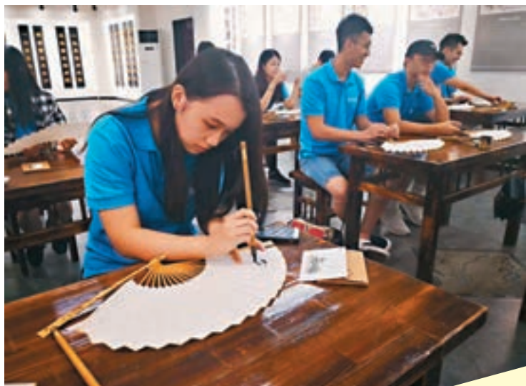
■學習古法製扇，親筆題字。