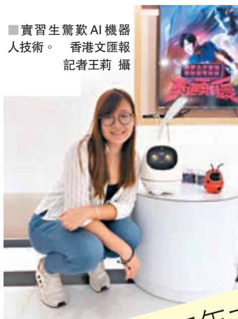
■實習生驚歎AI機器人技術。