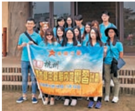
■「未來之星」參觀世界稻作農業起源地萬年上山。