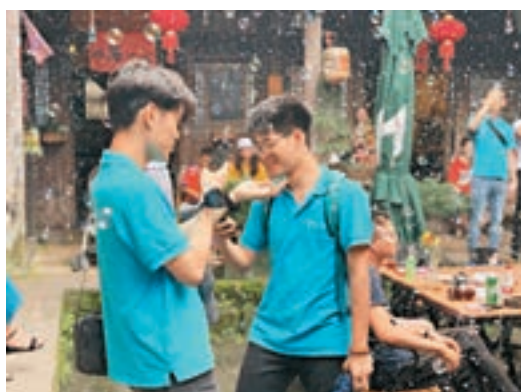
■百年古宅內的創新創業氛圍感染港生。