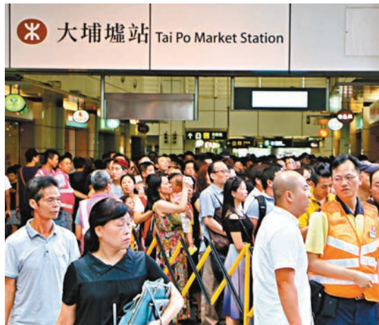
▲大埔墟站人龍情況。

港鐵車務營運總管黃現璋指，港鐵在發生出軌事故後至昨日中午時，已安排約200輛接駁巴士疏導乘客，同時在沿途各個車站加強廣播，以及增加近150名職員維持秩序，他向受影響的乘客致歉。