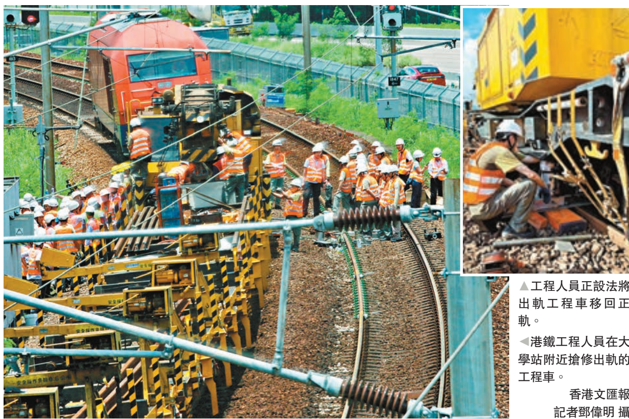
▲工程人員正設法將出軌工程車移回正軌。 ▲港鐵工程人員在大埔墟站附近搶修出軌的工程車。