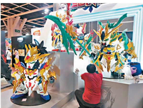
▲高達系列是每年動漫節常客。

場內亦設置體驗區，讓參觀者能試玩最新電玩遊戲，包括VR、手遊及競速無人機。今年為迎合大眾口味，大會特意增設懷舊格鬥遊戲區，並於區內設置近20部原裝街機，分別有《街頭霸王》及《拳皇》兩個遊戲，並邀請到前《街