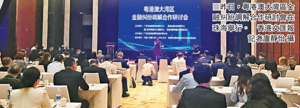
昨日，粵港澳大灣區金融糾紛調解合作研討會在珠海舉行。