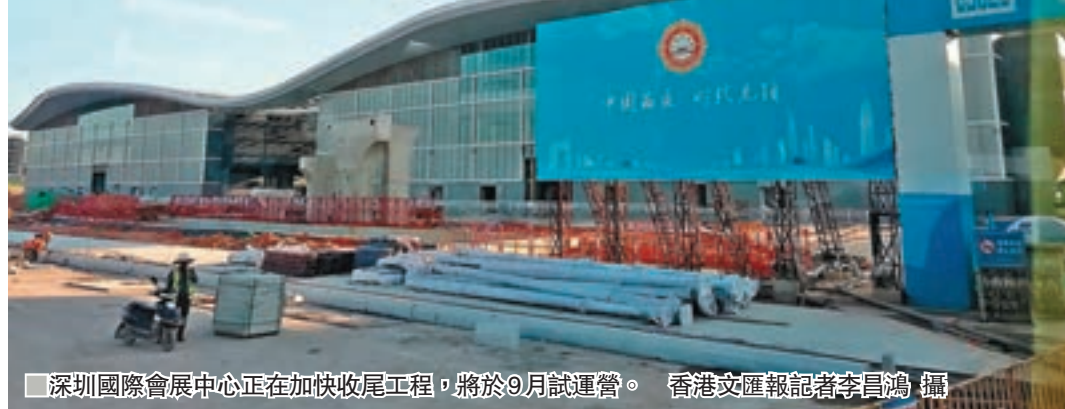
深圳國際會展中心正在加快收尾工程，將於9月試運營。

他告訴香港文匯報記者，此次大灣區工業博覽會匯聚全球頂尖高精度生產機械設備、工業自動化、智慧工廠解決方案、人工智能機械人、3D打印等。他們將首設國際機械人與自動化解決方案、精密金屬零件、工業壓縮機、液壓氣動元件等專業展區，將工博會打造成更為完善的全方位一站式工業技術博覽會服務平台。此次展會將以科技引領行業發展，物聯網、工業4.0、智慧工廠、工業大數據示範等一批智能製造新技術、新方法、新理念也將亮相展會。他相信，此次工博會將可以有力地促進大灣區智能製造、人工智能、和機械人等產業發展，也有利推動大灣區企業升級和創新發展。