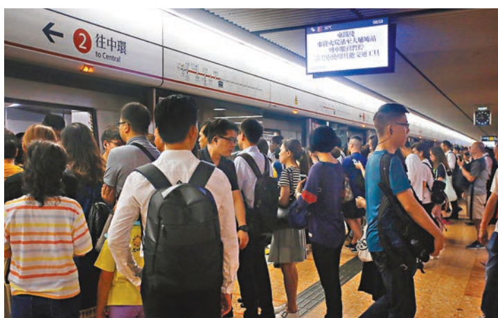
▲香港鐵路工會聯合會譴責激進分子。 ▲港鐵九龍塘站運作受影響。

工會對此表示堅決不能接受並提出譴責，同時要求鐵路警區嚴正執法，不能姑息威脅港鐵員工安全及阻礙鐵路運作的行為，並呼籲政府以至整個社會要關注不斷被衝擊的打工仔利益，及鐵路運輸從業員正面對的壓力。他們促請示威者盡快停止所有破壞鐵路運作的行為，還香港安寧。