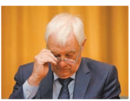
彭定康避而不談衝擊立法會和中聯辦大樓事件，被外交部批評選擇性失明、選擇性發聲。 資料圖片

港區全國人大代表、工聯會會長吳秋北一針見血地指出，彭定康對視頻片段的「解讀」只針對「白衣人」，而忽略「黑衣人」，顯然在縱容「黑衣」暴徒。事實上，警察已拘捕了許多「白衣」疑犯，彭定康的指控明顯在煽惑造謠，唯恐天下不亂，極其邪惡，應予嚴厲譴責。 他質疑，彭定康提出的所謂「獨立調查」，是為了打擊警隊士氣、瓦解警力，令警隊無法維持治安的陰險圖謀，更令人有充分的理由相信彭定康高度介入香港近期的連場暴動，參與策動香港「顏色革命」。