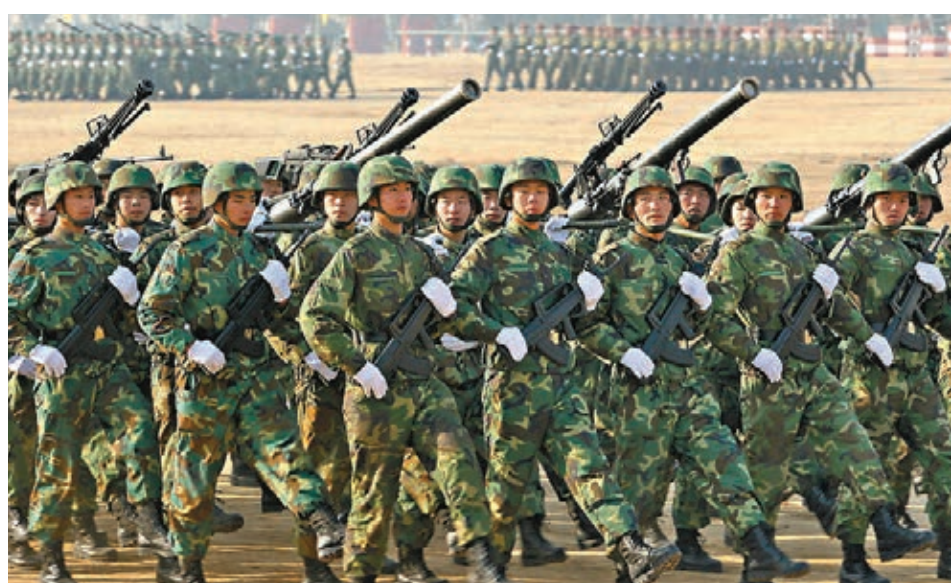
國防部表示，正密切關注近期香港形勢的發展，並指特區駐軍法已經有明確的規定。圖為解放軍操練。

特區可依法尋駐軍協助 根據《中華人民共和國香港特別行政區駐軍法》第三章第十四條內容，香港特別行政區政府根據香港特別行政區基本法的規定，在必要時可以向中央人民政府請求香港駐軍協助維持社會治安和救助災害。 香港特別行政區政府的請求經中央人民政府批准後，香港駐軍根據中央軍事委員會的命令派出部隊執行協助維持社會治安和救助災害的任務，任務完成後即返回駐地。 香港駐軍協助維持社會治安和救助災害時，在香港特別行政區政府的安排下，由香港駐軍最高指揮官或者其授權的軍官實施指揮。 香港駐軍人員在協助維持社會治安和救助災害時，行使香港特別行政區法律規定的權力。