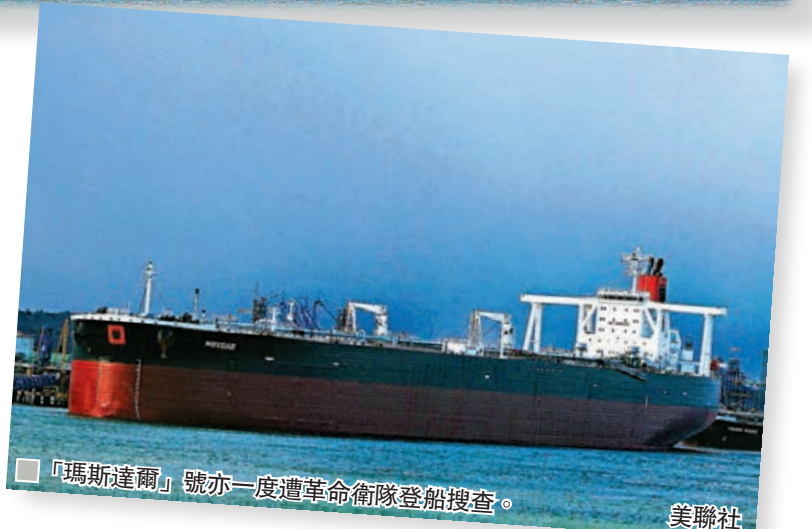
■ 「瑪斯達爾」號亦一度遭革命衛隊登船搜查。美聯社

隨着局勢惡化，在波斯灣營運業務的2,000間公司中，許多已下令船隻只可於日間高速駛過霍爾木茲海峽，減低遇襲或遭扣押的風險。 ■ 美聯社