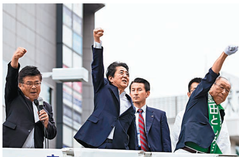
■ 安倍為自民黨候選人助選。

為提高選民投票意慾，Patagonia本月中旬安排員工與居民，在咖啡店內分組討論民生議題，如棄置塑膠垃圾、退休金不足和上調消費稅等問題，期望令選民更關心政治。拉麵店「一風堂」則推出優惠，只要食客從今日至本月31日期間出示「已投票證明書」，便可在全國93間分店免費「加麵」或「加蛋」。 ■ 綜合報道