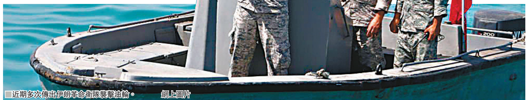
■ 近期多次傳出伊朗革命衛隊襲擊油輪。

美軍中央司令部同日發表另一份聲明，指美軍仍在推進由多國共同參與的海上「哨兵行動」，以確保船隻在中東關鍵水域的航行自由與安全。聲明說，美國承諾支持該行動，但行動能否成功，取決於中東地區及全球多國能否展現領導力，並各自作出貢獻。 ■ 綜合報道