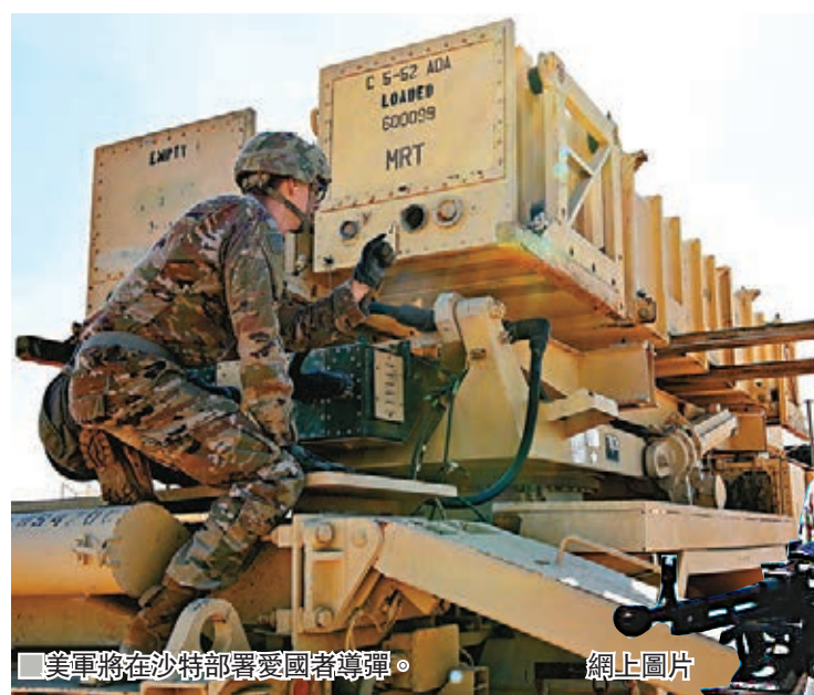
■ 美軍將在沙特部署愛國者導彈。網上圖片

伊朗前日宣佈扣留英國註冊運油輪後，美軍中央司令部隨即宣佈，將向沙特阿拉伯派駐美軍，以應對來自中東地區的「威脅」。