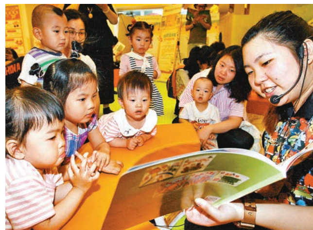
■根據國家統計局最新數據，教育文化娛樂消費的增長最快。圖為早前北京舉行繪本嘉年華活動上，工作人員為小朋友講述繪本故事。資料圖片

位，其結果就是我們仍然是人均收入增速最快的大型經濟體之一，為消費增長空間提供天然的保障，因此居民的消費潛力依然很大。