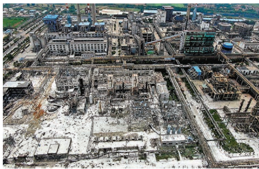
■河南省義馬氣化廠C套空分裝置19日發生爆炸事故致15死。圖為俯瞰發生爆炸後的義馬氣化廠。

事故發生後，國務委員王勇作出批示，「請應急部指導幫助地方，全力做好人員搜救、傷員救治等事故處置工作，盡量減少人員傷亡。要查明事故原因，嚴肅追責，吸取教訓，督促各地進一步採取措