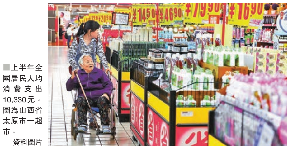
■上半年全國居民人均消費支出10,330元。圖為山西省太原市一超市。資料圖片

香港文匯報訊 據「中新經緯」客戶端報道，國家統計局最新公佈的31省份上半年居民人均消費支出數據顯示，上半年全國居民人均消費支出10,330元(人民幣，下同)，實際增長5.2%。國家統計局國民經濟綜合統計司司長、新聞發言人毛盛勇在近期的新聞發佈會上表示，上半年消費增長對經濟增長的貢獻率達到60.1%。