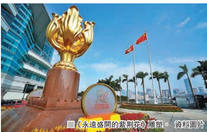
■《永遠盛開的紫荊花》雕塑。資料圖片

文脈傳承，不斷推動中國工藝美術創新發展，積極促進藝術創新與地方政府、企業的協同合作。在我國工藝美術發展轉型期，探索以「創新驅動」為核心的新時期工藝美術發展模式和城市審美文化建設。在國家重點項目中他多次發揮關鍵性作用，在城市文化建設和傳統產業轉型領域更以其不懈的努力創造出豐碩而有影響力的成果。